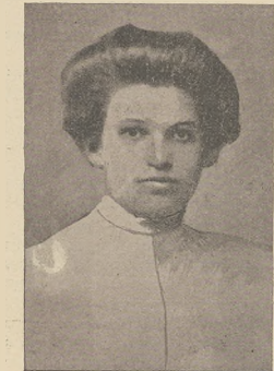
א ווידעש מיטלעך נעמען: צווייטע גרונבערג

דער דערשטע פֿיכעלבערג האט איבערנעלאזט א אלטע און דריי קינדער.