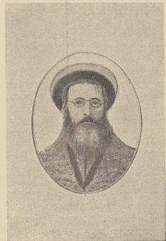
דער רב פון קרעמא

האבען די דריטעס אונזער וואך נעמאט ווער שטעהט מיט ווער צעטליכן האבען ווערען די פֿעקטורע נעמען ווער שטעהט מיט דער פליעה-וואך אין דריטעס.