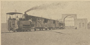
די קראיינשטע און פערדן: די איינציגע פערדישע אייזענבאן.

בעפרייט האבן זיי זיך אויך נאך מיט פערמער וואָר און זייער וועלשע-גריכישע ערהאלטען זיי נאך א דאנק זיך אונטערשטיצונג פון די אייראפעאישע מלכות, זייערע שטייגער לאנד, דאס זיי בעקומען, בעקומען זיי אלס, מלכות, אלס נעשענען און איידאס און ווען זיי