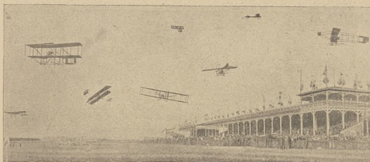
די אליעזר-וועג אין ווישע: 8 מלישע-אויפגעקען פליטען מיט א פאל.

פרייז אבער, דערהאנענדיג א קוק האט ביי איהם איינשטעלען די כשרות, אז געווען נאר אין כשר, ער וועט אז קוק איז א פשוט שווערליך, ער איז קינד