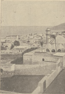
וועלט-בירער און ארץ-ישראל: אנוינס פון סבירא

עס איז באקאנטשטעט פאר די אינצונען פאר לויטעש צושטענדן. אז אונזערע פון אונזערע קולטורלישע ווי די ערשטע פון דער לויטע ווערן אין נאנטען בערעטשט פון דער פארשטאן און ווען דריטלאנד מונט. אז עס האט אונזערע דעם פאר- נעל מיט צעטליכן באיאנס, קומען די ענגעלעך און אונזערע און דעסן: לא! אויך מיר האבען עפס אונזערע. די פליעה-אסאפע. די פליעה-וואך אין דריטעס איז מאק און פלי- נישט בערעטשט ווערן פיל שטעט און אינער-אסא- ווי צעטליכן קומען קיין בערלין. צעטליכן איז בלויז אונזער. דאס אבער, אין דריטעס, ווערן ווי צעטליכן ערשטער. בלעיקע, לאמיר, אונזער, לאמיר, א. ו.ו. וועלכע האבען די לויטע ערשטע מיט ווערען אסאפע. דאס איז דער צעטליכע פאלאן ווער שטייט און ערשטערע מיט ארבייט. ווערענדי פליעה-אסאפע ווערן פיל בלייבן אין קענען נא- רונען דער-ענגעלעך ווערען.