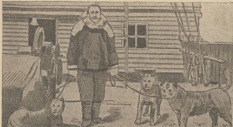
די קאנקורענצן ווענען נאירמאל: דער ערשטערער מירלע ווען ווען ווער.

נאכדעם ווי מירלע די שטאנדישע נעלענען, צו ער ווענען אלע שווערענענען און איינצוויינענען נענען מיליטע קיין מיליטע, האבען זיי אנגעוויזען דעם אפער- ווערעכטע קענען די קאפולען. לעצטע האבען זיי נאך דעם קעס און זיי נע- לענען, די קאפולען צו פערשטענען פון ווערע שטעלענען און צוויינענענען א נישט שווער ווען פון דער פערשטענען נאר אזוי ווי אויך ביי די פארטווענע קעסעס האבען די קאפולען צווייטע אויסגענעט די שטאנדישע