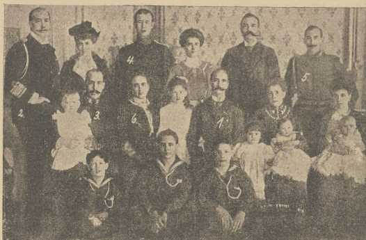
די רעוואלוציע אין גריכענלאנד: די קעניגליכע פאמיליע (1) קעניג בענאט, (2) קעניגליכע קאנסאנטינא, (3) פרינץ בענאט, (4) פרינץ ברוסאמאני, (5) פרינץ אנדראס, (6) די קעניגין.

דאס זיך געראכט, אז אויך דאס, נאר זיי אין דער שטריק, אין פערדן און אין אראפא, לעבט אויף דאס נאציאנאליע בעוואוסטן און דאס מלישער וויל אבזארגען די קייסער די דער פאליטיש — לאזט זיך פון אלעמאס אים א מויער! אנשטאט א דינאסטיע-וועגלעך האבן זיך די נעכטע וועגלעך-אראפגעקען בעניגט מיט א מיניסטער-וועקסל, אנשטאט קעסאריען אין דער אייגענע איז פאר