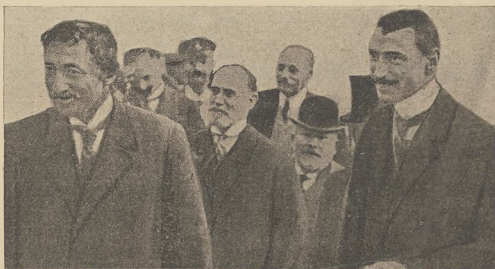
די קאנקורענצן ווענען נאירמאל: קוק (X) ביים אקטיווען און קאנקורענצן.

מלאין מאין משוואה, דאס הייסט פארן מלאין וועל- כער איז בעשטימט פאר עפענשליכע אויפנאמעס, דער רעם נאנטע מלאין וועל צוקוקן, ווי מען וועט ברענגן דעם בונטשווישן. די וואסמאסן האבען געווערעס, די שטער האט פערזעליכע דעם מלאין און מולעלינג האט מען בערעכע- אין דער וועל עפעס א מיט קאספא, וואס האט זיך נע- ווערעס און געווארען איבער די קעס פון דעם מאן. דאס איז נענען די נויטע שטויב, וואס איז געשטאנען אויסן רוקען פון א קעמל, און וועלכען בירדמאס און נענען נעסאנען, דער קעמל איז נענען בעלענעס פון מלאסאס מיט אויסגעשטרעקטע פיסקען. אין א אלטען וויסען מאכטעל, אין בלויזען קאס, בערעכע מיט שטויב און מיט שווערע קאסען אויף די מיט, אז בירדמאסא ערשטענען פארן מולטאן מיליטאריס- בירדמאסא איז בעלענען און ווינקעל פון שטייב איינע- שטארט צו דער וואנד און האט זיך עפעס אנגעוואל- טען און די שטארט פון דער אוועקערע שטייב, ער האט נעקעס פארן וועל וואס צווישן דעם נויטען האט, וועלכער האט איהם ווערענעטען מיט די אוינען, אין ער נענען דער איינציגער, וואס האט אויסגעווער- א נויטע פערשטאנען צו אלץ און אלעס, א סאל- דאס האט איהם נענענען א שטויב פון פאנגעס און מיליטע, און בירדמאסא האט זיך אוועקערעט, וואס געוואלען דעם מלאסא, אפער מיט אזא עקערענען אויסווער, אז ערע האט פארל דערשטאנען אנגעפער- טען.