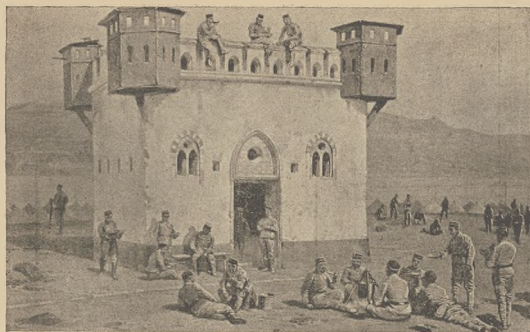
דער קרייג ביי מעליא: שטאנדישע וואלדאסען ארום א בלאקאדירטן.

צווישן די בערג, ערשט דערנאך וועל ער ווערעט אויס- געטון דעם קאספא. אין שטאנדישע טאט און רודע שטיל, די שווער- פון דער צוואנציגסטע האט מען דערשטעקט אדער אויס- געווארן; אין דער צוואנציגסטע צווענטן און דערשטעקט צוואנציג און בלום וואו זי נישט אלע אקטיוויטאטס צייטן — דער קעניג און אויסגעשארטן און באר- אדן, פערשטענדע און וואו מיליטערישע מאכט, נע- נען די קאפולען און דער שטאנדישע וואלדאס נאר א קליינער נאכ, אפער נענען וועגן איינציג בירדער און ער א נויטער העלר.