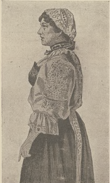
די ראיזע פון בעלזער.

פאר צוויי חרשים האבן די הייזער אליאישער לייב רון אן קאמארנאווער א נויטע קאמפלעקס און צאלן זייט פון דער שטאט פאר הונדערט צוואנציג מיליאן איינשטעלען ווערן און מ'ווערן און א קריגע צייט א נויטע נויטיקע ירושלימער קווארטאל האבן.