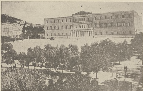
די דינאסטישע קרוינע אין בריעכענלאנד: דער קעניגליכע פאלאס אין אמסטער.

און געוויסן אומאנג ביים פאלק און אויך א טייל פון