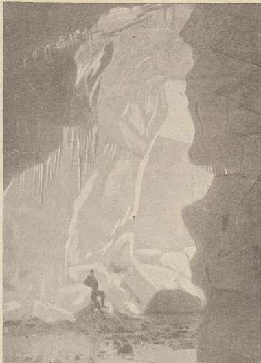
די ענפערעכטע טיפן פארלאנגט: קוק זעט און א ווינעוועלע און בוקלאנד.

פארענס יאר האט ער נין אונטערצייגן א שווערער אפגראבען און און נאכן נעוועלס געווארן. אבער פראנץ פלעבע מאלינען צווישן אויס האפאט און ער אלץ וועטער נעבלעכען ביי דער פראוואקירטער שפעלע אפגערעכט האט ער נעוועלס דעם נישטיג וועלנעלעכען ווען. ווען צו ווערען פרויעליך צום קאזער. דענעם פארענדיקן איז אבער נענען די וויפריס