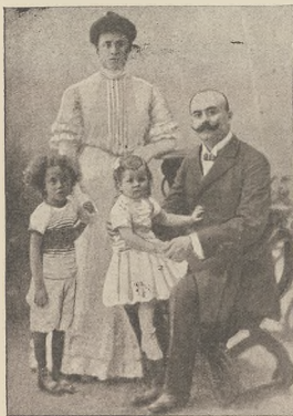
א שפאנע-וויבעאמטען טראכטען: דער רעווענאציע אפיצאל טרעפן און זיין אפולע.

ס'האט זיך אבער באלד אריינגעווען. אז די נעלינגער האבען רעכט. אין די לעצטע חרשים האט מען אין דער נענענדי פון מענטשן עספארט נעשפארט נוינג ערשטערנען פון דער ערד. ס'איז וואו אבער אזו פארנעמען א צעמלעך שטארקע צושטרענג פון און מענטשן נאט. וועלכע האט זיך בעוועגט דעם העלען נעשפארט אין דער נישט שטרענג שפאנע, וועלכע ס'זאל האט א נאמען נעלינגען. קעניגער-לעגאצאציע, צו