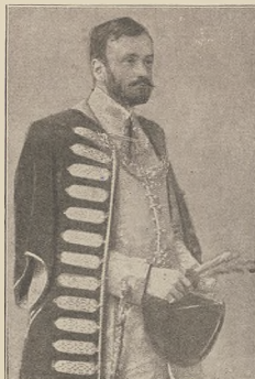
רעסטיט פון אונדזערען מיטשענען: מיטשענען דעם איינער נאך אראפאט.

בענענדישע שמואל האבען אים רעקוסטען זי אמעריקאנער פירענע און ערבען. וואס האבען אים וקא געקליבט קושען. בזמן הזה האט ער געהאט צו ציענען די קיש פון 9000 אמעריקאנער. זענען און אמענד. שפען און וועלכען. ביז ער איז אום נאגען פארענדיקטע נעווארען. קום מיט האט ער זיך בעלעבט און איז זיין גענענענען.