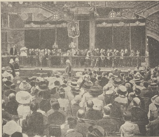
עספאראנטא-האנגרעס און בארעלמא: א בילד פון דער ערשטער וועלט.

דחתו כל הארץ שפה אתה וברבים אתים... אין דער ערשטער צייט נאך דער ערשטער פון דער וועלט האט די נאנצער ערד גענוג און שפאנע מיט ווייניג נעצערלעך ווערן. שפעטער זענען די שפאנען פערשידענע נעווארן. יעדעס מאלק האט זיין לשון, יעדעס לאנד זיין שפאנע. אזוי און איינע פערשידענע נישט מערד דעם צווייטן. יארדאניע ווערן דורך די פערשידענע שפאנען אזוי ענטוויקעלט. אויסשן די פולקס און איינגעפירטע און ענטפערט. איינע האט נישט מערשאנען דעם צווייטן איינע האט דאן דרווישערס מונס ארבעטן. אזוי דארף זענען ענטשאנען אויסשן די מענטשן און צווישן די פולקס קאראשנא. האט און נירא האט