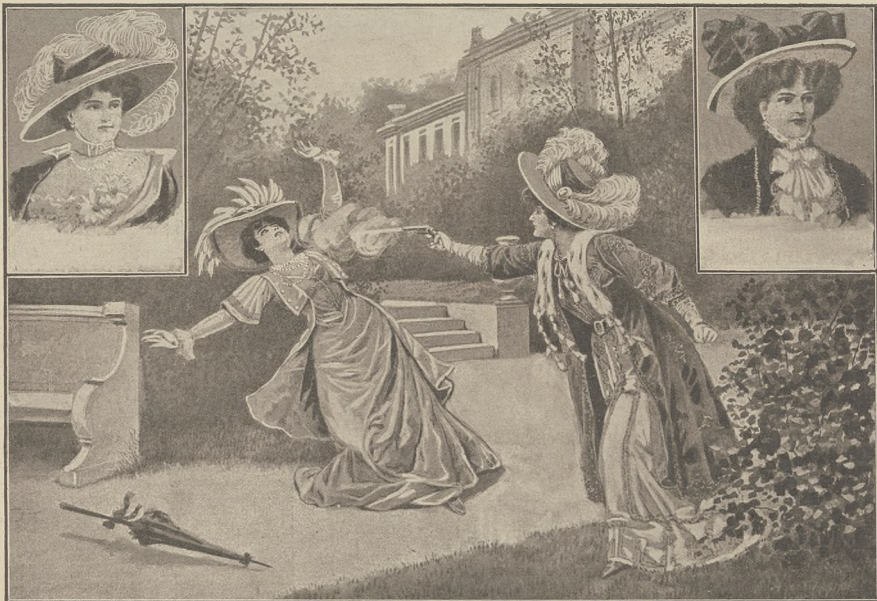
בלוטנער קאמפף צווישען אמעריקאנישע מיליאנערינען: די איילענד-כיינגס נום גיין דערשיקט אירן רויזאן סטיבס.