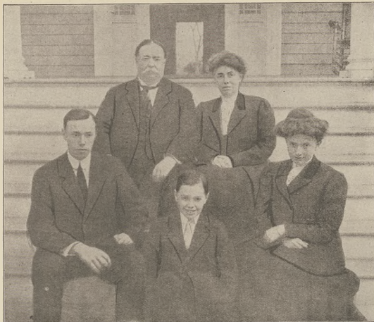
אסטעמאט אירען אבערזעצערען פון דעם: סאטא און זיין פאמיליע.

זיי פארענדיקטן די וויסנשאפט פון נאדראפאל און נאדראפאלעריק. און האלט א שטרעקע פון 3000 מיל. און אן א ווייב פון ברישען וועג אבער וועלען עס איז געבאנען דער מעדיצינישער מאשיינע. זענען זיי נאך שאפען. די עקסמאטען. צו ווייב פון דער פרייער. וואו דער מענטש האט אין פארלויב פון די לעצטע וויינערער אירען ענטשערט זיין צווייליאנציק. זענען זיי געפליבען.