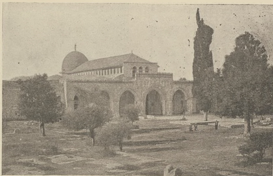
ירושלים אלס וועלט-שטאט : דרום-ווייס פאר'ס עסקעראמא.

ערעקט אויף נויטע געלערדעס אירקלען אויף בריי-טאל מען קענען זיך בענווען מיט דעם עסקעראמא. מערען סאלקסוועק האבען זיך מא-וי נישט איבער-דעסער.