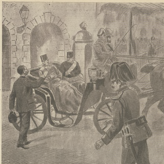
די ביטע פון א קווינליכע ריכטער: דער סאָוויאַניטישער האַמפּטרינגער יאָסאָ אַפּטרינגער ריכט און זיין בייגער.

האט זיך ירושלים מקרר ווי 5 מאל פערדאקלעט. און ס'איז צו ערשינען אז מ'טוט דער צייט ווען עס זיך ענטווערלעך צו א נויטיקער וועלש-שטארט ווי עס נעמט צו זיין.