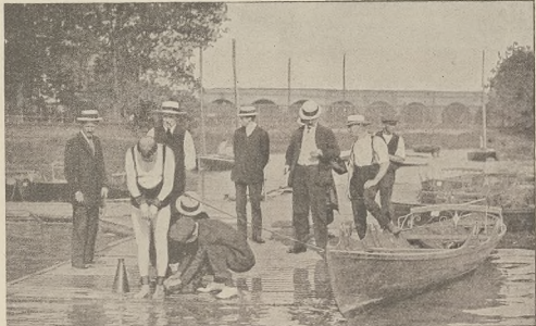
בייטעמסער שוויטע : דער שוויטעמסלער נומער וועלכער אין געשוואמען א טייל מ'ס געבורגענע הענר אום 6טן.

אין דער ערשטע נאכטאמאט'שארטען. ווען מ'רעד קאטע אין וועקען דער באשעל לענג און נ'ר עקעהלע נ'זלה. וועגן מ'זעהט איינעקומען צו זיי עלעאנטע ר'ה'רען און א אטמאספערע וועלכער וויל אומפונקט א קראווען. אין דעם מאכענט רודרע'ס זיך דאס קלינגען פ'ן מעלעשאן פונעם צווייטען צימ'ר. לענג געהט דארט'רין ארען צומאכערדיג דאס ספעטער פון זיין שאלטער און פ'רש'ט יעסערדיג די קאסע. אבער אין דער אוילע לאזט ער דא'ס דעם שליסל שטעקען דעשילט פרענס אוינ'ר פ'ן די פערטער דעם אטמאספערע צום וועקען א קאסאברעה. שליעסט אויף דאס שאקעלע און האט צו 110 מאנקאטאנען צו 1000 קראנען. איצט פערט'ווי