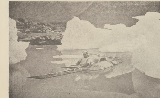
די עסקסאפטן : א עסקאט אין זיין שליסען, צווישען אייז-בערג.

אויב ריעווער פלאן וועט געראטען דאס וועט מען ערשט שפעטער ווערען.