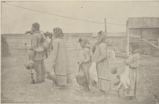
די עסקסאפטן : עסקסאפטן פאר זייער זומער-וואסונג.

4 יארען. ווען זיי האבען שפעטער נעמט מערצאבען אויף אלע זייערע פארדערונגען.