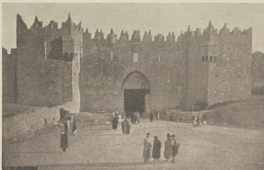
ירושלים אלס וועלט-שטאט : דער שער דמסק.

ירושלים די שטאט, וואס ווערד בעראכט אלס הייליג פון אלע פעלקער, האט זיך קריסטען און