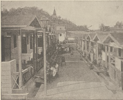
ערדציטערניש אין מעסינא: די קעניגליכע פאלאס-מאסט.

פאמיליע פאסטען צווישן אמעריקאנישע פירען וועגן נישט קיין וועלענע. מאכט פערלך קען פון און די דארמינע צייטונג לעזען וועגן וואסען פירען: