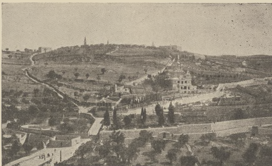
ירושלים אלס וועלט-שטאט : אנטווס פון הי-ווערען.

ווי דאס סארגעוועקען אויף די אביצעלע שטאט פון דער רעפארמאציע אויף וועט עסקעראמא ווי די אביצעלע שטאט פון דער וועלט-פערקער. דער דאס וועל די סטאט און אינוואנערען. די אנטערגעוואלע פער-ווענווענגען עט. וועלן ווער פילאזאפס ווערען. די נויטע האנדעלס-ווערען זייער נישט מער בענטווערען צו האלטען קארעסאנדענעסן מא-די פער-שערקען שטאטען אין די ראיאנ-ווערען און אין די האטעלס וועט מען נישט ברויכען האלטען שטענעלע פערקער-פער און קעלער פאר ענגליש. סארגעוועקען וועט איינפארקענעט עט. - מיטען זיך נענט. אויף איבערלא