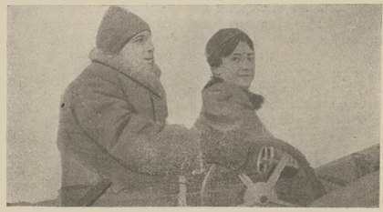
א לויס-פילעהרעארד: דער דאספליטער לאמחאס און זיין שילדערן