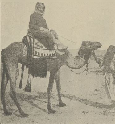
א פארשונג ווינענער ערפארענע: דער טראקטורעס העימאן בוקארדס.

למאמא וואס אבער נישט און שווימע נישט. אס דערוויל אומגערייכטען ער כבוד געקענען זייען און איצט איז אויס געלאנגען צו עררייכט דעם העכסטען רעקארד וואוואל און דער הייך זיין און דער שנעליכקייט.