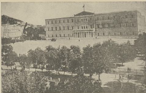
די שמה פנים קעניגליכען מאלאך און אהרן: דער קעניגליכער מאלאך.

הזקית וישם אונגעמאכט. ערשט ארום 8 א זיבער און אונזער האט זיך אינגענעמן רעם סייך צו פערלישען. ווי מיר האבען שוין געזאגט, זענען אויך געווען גענשליכע קריגער, און סייך איז אומגעקומען, ווערענדיג סייטיקער מצ'שאפן דורכן סומם. רעד געהילף פון בראגט סייטער קאמפאסאן געזעלעשישט. איינע סייך-לעשער זענען שטיק פערזאנליכע געווארן. אזויק רעד נויטן עולם, וואס איז געשאפן א נאגען מאן ארום דעם ארם פון דער שמה. האפען די ערשטיגע בארישען און נגוים אונגעזעלעכע דאס וואס עס האט זיך אינגענעמן צו ארבעטן פון סייך. נישט קענדיג אויף דעם, וואס דער מלאך איז געווען ארבעטניגעלע פון פילע מיליאן און סלאביו. מאליקום מאנאן אז געווען אסעקורירט אן אסעקורירן געזעלשאפטן.