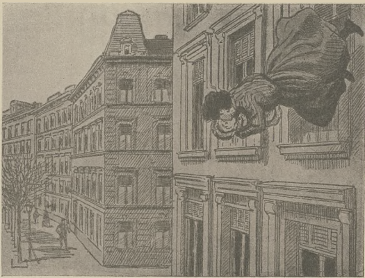
וועלכעסאָר און אַ פּוּטער מיט אַ קוּד.

ער האט איינגעלארען 40' זיינע חברים אין א לאנדארער האַמלע אויף א מיטאג וועלכעס האט גע' קאָסט ביינאָכט 50,000 מאָך דאָס רײַשׂ אַן יעדער נאָכט האָט אױסגעגעבן פאַר צױבאַ 1200 מאָך. דער מאָך איז געווען זעהר אַרײַנגעל. עס איז גע' ווען א נאָרדאָרשׂיטאָג די קעלנער זענען געגאנגען אַרײַן געקלײַדעט װי די עסקיפּאָס, די נעכט זענען געקומען אױס אַ קאַלעײַנען וויסען מיט וואָס האָט אױסגעזען װי אַ צױבלאָק און אױן דער מיט איז געלעגן אַ ובלבדן מיטשׂך. מאָריקער גע' נאָרדאָרשׂיטאָג. די ווערע זענען גע' ווען בעקעס מיט ווייסע קרוואַנגען און האָבן אױסגעזען װי קלײַדער שטעט. דער נאָרדאָרשׂיטאָג איז אױסגעפאַלען זעהר אַרײַנגעל און זײַן אראַנשער, קאָן מיט אױס זײַן זעהר צופאַרענען. די נאָנע וועלכע'ס שׂרײַבט אױבער אױס און די אױלום'דיגע צױטונגען ברענגען אַרײַנגעלע אױלום'דיגע פּאָפּען און רײַעסע וועלכע'ס שטענען מיטאָג.