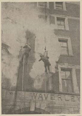
הויז-דייטונג מיט וואסק

דאס רוב אסטראנאמען מאכען. אז נעמען וועט דך די גאנצע בענענענדיש פון אונזער ערד מיטן קאמפס האלבע וואס דארף פארקומען דעם 18-טן מאי. ערווענען מיט א וערן שטערן צושינגען פון פאלקענע שטערן אקראם אז א שטערן-רעגנען פון וועל.