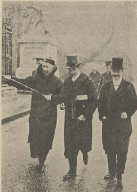
א בניעושיער דראקער: מורדעו-סיס אין בעלי-יוטא פון ווינע הויז.

דער סייך האט זיך אריבערגעצויגען אויך אויף איינע געזענע יודישע, אבער דאס האט עס קיינארעם