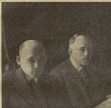
Pan Minister W. R. i O. P. Janusz Jędrzejewicz oraz Pan Kurator O. S. Kr. Eustachy Nowicki.

Dnia 14 maja 1932. Udział młodzieży w pochodzie LOPP. i Czerwonego Krzyża.