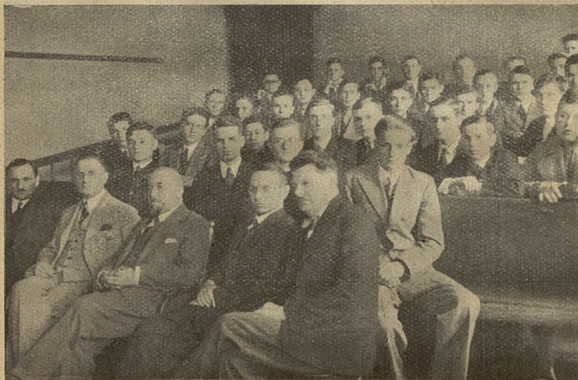
Ostatnie zebranie Koła wychowania państwowo-obywatelskiego.

Koło zostało założone w drugim półroczu ub. roku szkolnego. Członkami jego są uczniowie tut. Zakładu od klasy V—VIII o zachowaniu i postępkach conajmniej dobrych. Celem Koła jest