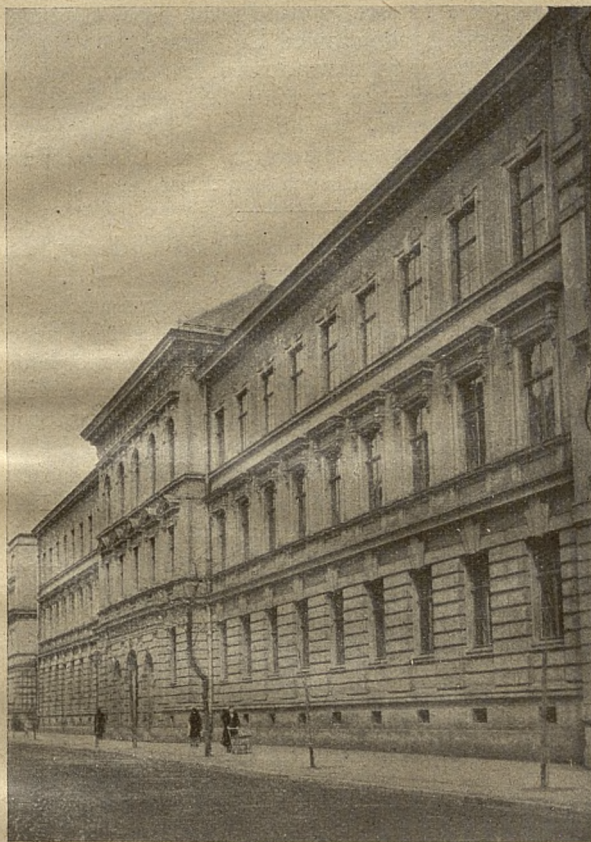
Budynek Państwowego Gimnazjum III im. kr. Jana Sobieskiego w Krakowie, ul. Sobieskiego L. 9, Tel. 13454.

Zakład mieści się w budynku rządowym, posiada obszerny podworec i plac do zabaw oraz oddzielny budynek, przeznaczony do ćwiczeń gimnastycznych, nadto ogródek.