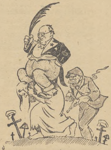
Niosą światu „szczęście“ i „raf“

W ten sposób publiczność polska jest zmuszona korzystać z żydowskiej literatury. Zatruiwają ją powoli idee żydowskich pisarzy, staje się coraz mniej na nie odporna, a