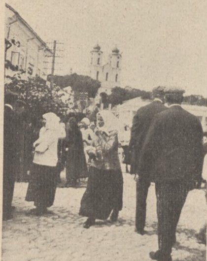
Rynek w Sejnach.