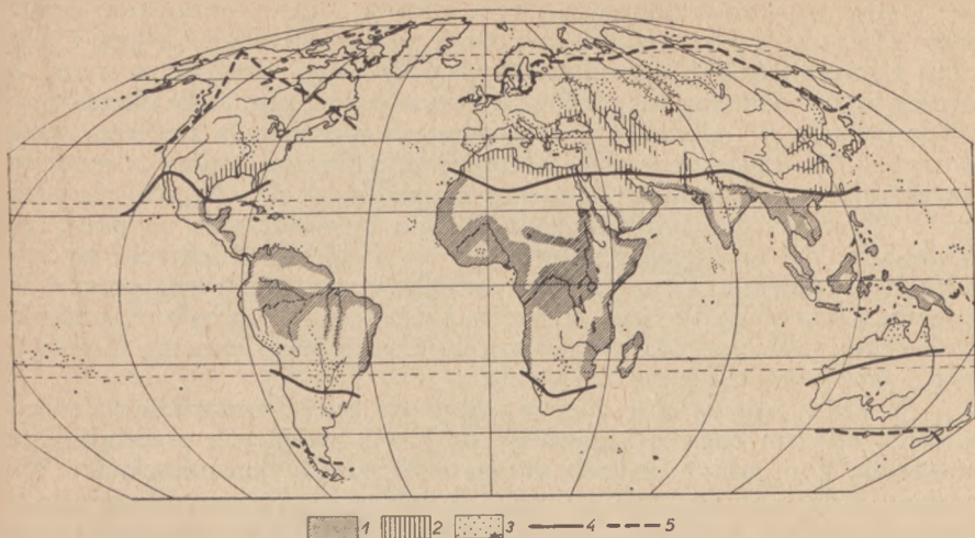
Ryc. 47. Rozmieszczenie malarii na kuli ziemskiej. 1. granice obszarów posiadających malarię przez cały rok. 2. obszary o ciężkiej malarii sezonowej. 3. ogniska malarii okresowej o łagodnym przebiegu. 4. izoterma 16^{\circ}\text{C} miesiąca najzimniejszego. 5. izoterma 16^{\circ}\text{C} miesiąca najcieplejszego.

graficznej, a wypadki łagodne notowane były aż na półwyspie Kola. Przytoczone zjawisko łatwo da się wytłumaczyć; epidemia atakuje skuteczniej ludność ubogą, niedożywioną i źle ubraną, armię w polu i tłumy wygnańców w czasie wojen czy zamieszek. Poza tym zaniedbana uprawa roli powoduje zwiększenie się błot, a intensywne mieszanie się ludności wzmacnia zasięg terytorialny malarii.