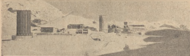
Sestriere w Alpach włoskich.

dzą również sklepy, wszelkie współczesne instytucje użytkowe (bank, poczta, telefon, telegraf) i ratusz z pisztalem.