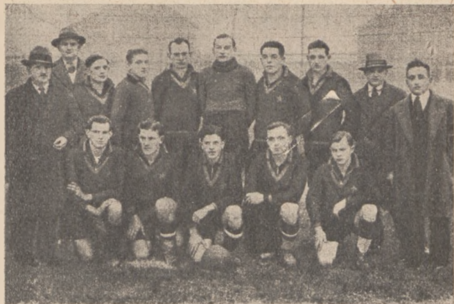
Jedna z najlepszych polskich drużyn piłkarskich we Francji: „Pogoń-Marles I”

mujących stanowiska wymagające kwalifikacji zawodowych. Z elementu robotniczego wytworzyło się kupiectwo zorganizowane w „Związek Kupców Polskich we Francji”.