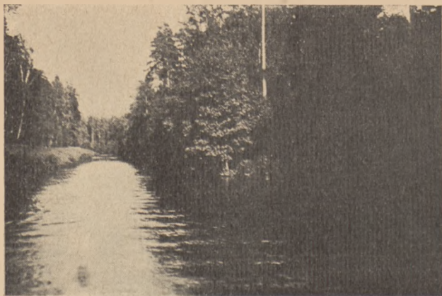
Kanał Augustowski. Sosny dochodzą do samej wody.