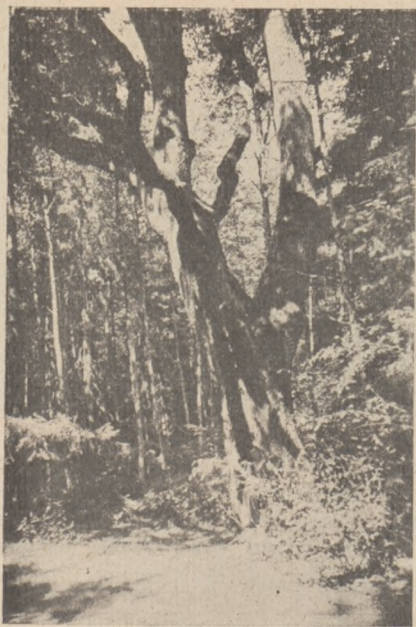
Z puszczy Augustowskiej.