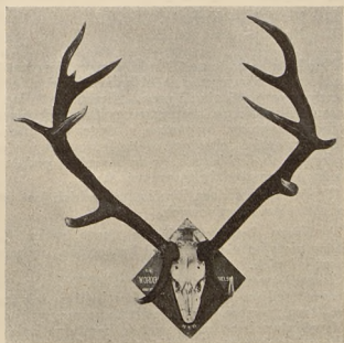
Nr. kat 100. Byk Juliusza hr. Bielskiego. II miejsce na pokazie; I miejsce wśród byków karpackich.

20. Nr. 48 (punktów 174,2). 20.IX.1905. Buda-Majdanek, pow. Tarnobrzeg, woj. Lwów. Zdzisław hr. Tarnowski.