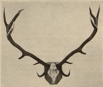
Nr. kat. 102. Byk p. Zygmunta Kamińskiego. III miejsce na pokazie; II miejsce wśród byków karpackich.

Wyżej wspomnianem już, że o ile chodzi o wieńce, to pokaz wypadł pierwszorzędnie. Istotnie takich wieńców Warszawa jeszcze nie widziała i to zarówno pod względem ilości, jak i jakości. Na pierwszym pokazie (r. 1931) było wogóle 25 wieńców, z czego w ogólnej klasyfikacji nagrodzono 7, w tem medal złoty otrzymał tylko jeden wieńiec. Na drugim pokazie było 36 wieńców, z czego odznaczono 13, w tem złotem medalami 6. Na obecny pokaz zgłoszono 119 wieńców, z czego w ogólnej klasyfikacji odznaczono 46. W tem jelenie karpackie otrzymały 6 złotych medali, jelenie z pozostałych okolic Polski 10 złotych medali.