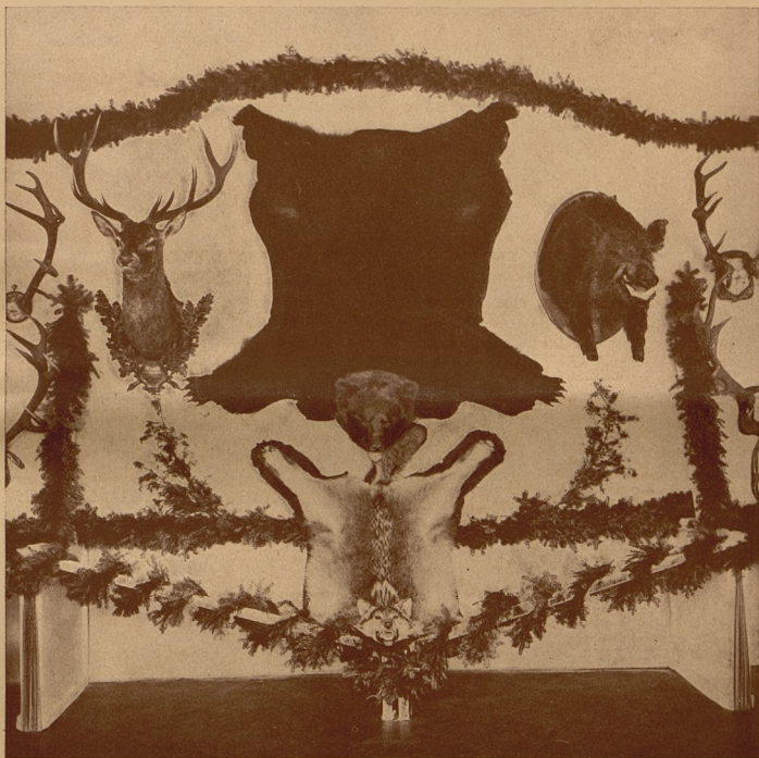
III Pokaz trofeów łowieckich. Stoisko Pana Prezydenta Rzeczypospolitej, Prof. Ignacego Mościckiego.

ORGAN POLSKIEGO ZWIĄZKU STOWARZYSZEŃ ŁOWIECKICH