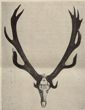
Byk Z. hr. Tarnowskiego. VI miejsce na pokazie; II miejsce wśród jeleni nizinnych.

Drugim z kolei jest wieniec Juliusza hr. Bielskiego, będący jednocześnie pierwszym wśród jeleni karpaccich. Oto jego wymiary: długość łodyg: 109 i 121 cm, długość odnóg ocznych: 40,5 i 45,5 cm, obwód róż: 25,5 i 25,5 cm, obwód łodyg dołem: 17 i 17 cm, obwód łodyg górą: 17 i 18,5 cm, waga 9 kg, ilość odnóg 15, rozłoża 80 cm. Ubarwienie, uperlenie, korona i zakończenie odnóg pierwszej klasy.