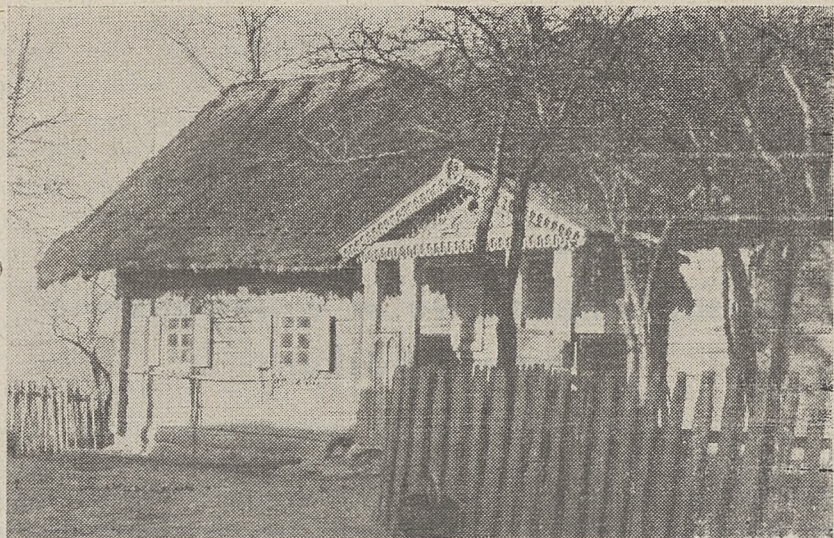
Chata wiejska w gminie raduńskiej pow. lidzkiego