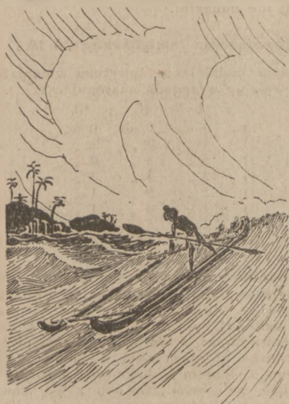
Łódź ludów Polinezyj.

W stosunku do krążownika zachowywali się jak ciekawe dzieci, ale i jak złodziejzaki, co radziby coś ściągnąć jeśli zauważą, że źle jest pilnowane.