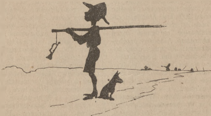
Ostre pogotowie. Rys. St. Jarocki.