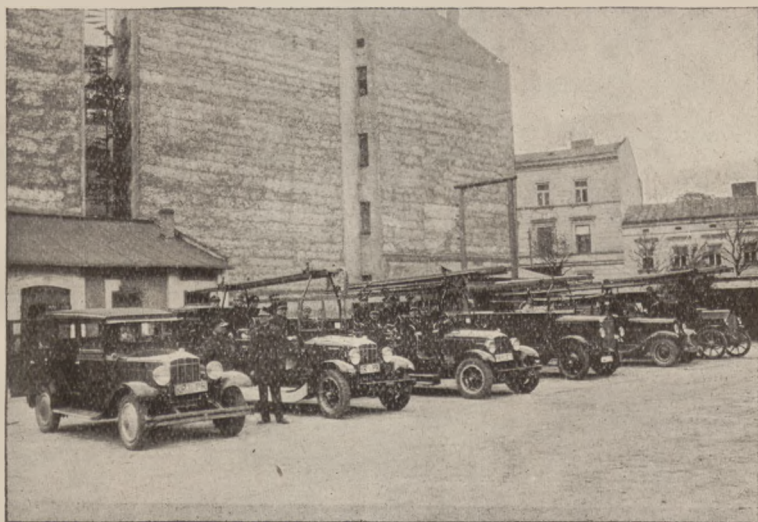
Wojewódzkie zawody wyszkolenia gazowego w Krakowie. Tabor automobilowy Oddziałów straży pożarnych ochotniczych przygotowany do akcji.

Po krótkim żołnierskim posiłku udały się Oddziały na Błonia celem wzięcia udziału w popisach. Na 7-miu wozach automobilowych,