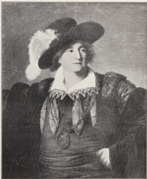
Fig. 1. Bacciarelli (?). Portret Stanisława Augusta.

Prócz tych dwóch większych kolekcji uzyskało Muzeum tą samą drogą szereg monet i medali polskich, z których niektóre są prawdziwą ozdobą gabinetu numizmatycznego. Są to,