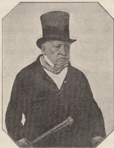
Jenerał Józef Dwernicki.

razem 3079 osób za ogólnym wstępem 1.509 K. 90 h.