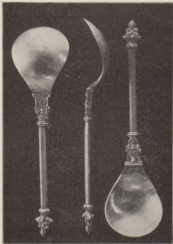
Łyżki polskie z daru hr. II. Steckiego.

pocziwy jest skarb prawdziwy« albo »przy każdej sprawie pomnij o sławie« lub na innej »nadobnie strojny, kto cnotą hojny« lub też »mieście na baczności swoje przypadłości« i t. p. Ładną i pokazną kolekcję, bo liczącą około 200 sztuk, stanowi zbiór ozdób srebrnych z X i XI w., filigranowych, wykopany w r. 1859