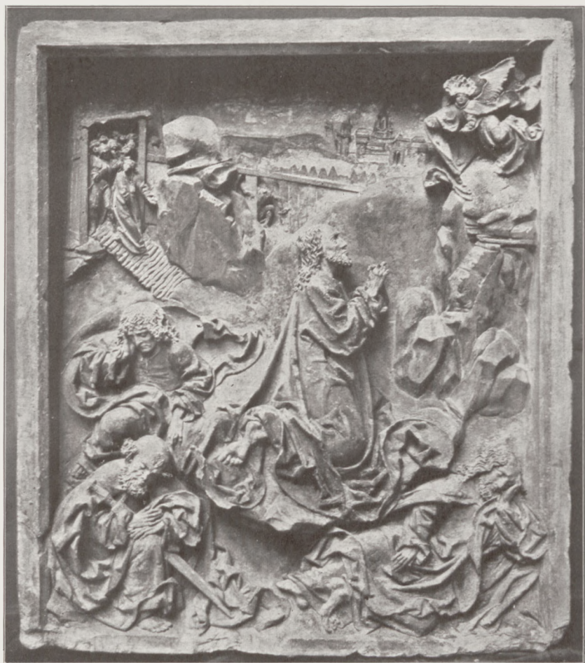
Wit Stwosz »Ogrojec«.