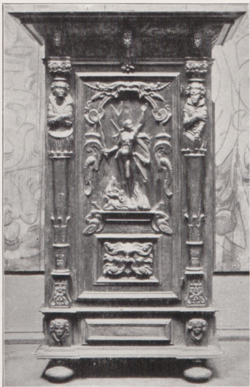
Szafka z r. 1646.