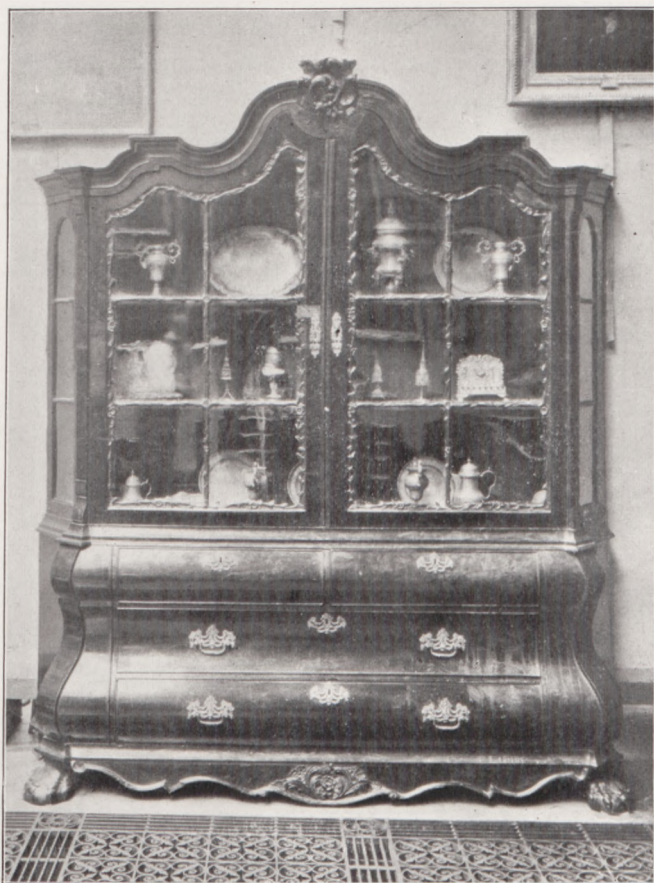
Szafa wystawowa z XVIII. wieku.

Łebkowsy z Przeławic: komódka z XVII. w.