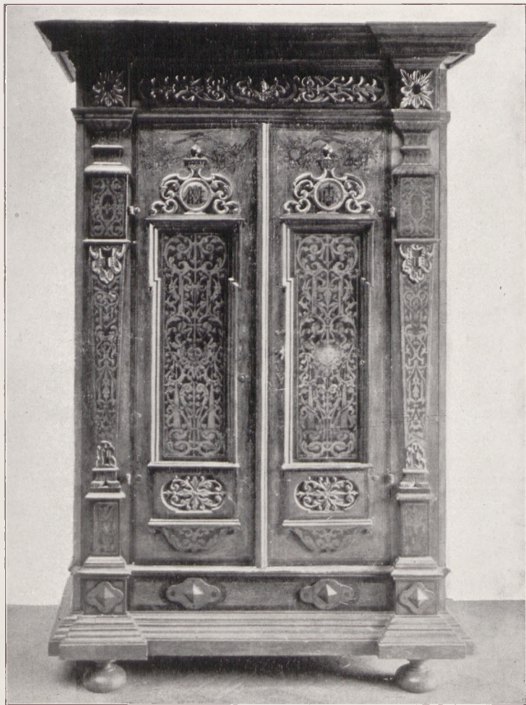
Drzwi szafy z kościoła św. Anny z r. 1646.