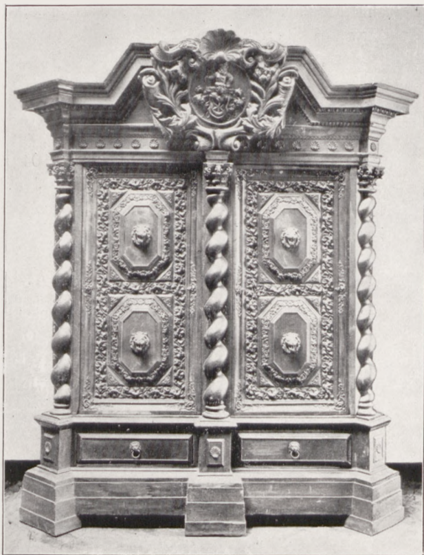
Szafa gdańska, r. 1696.