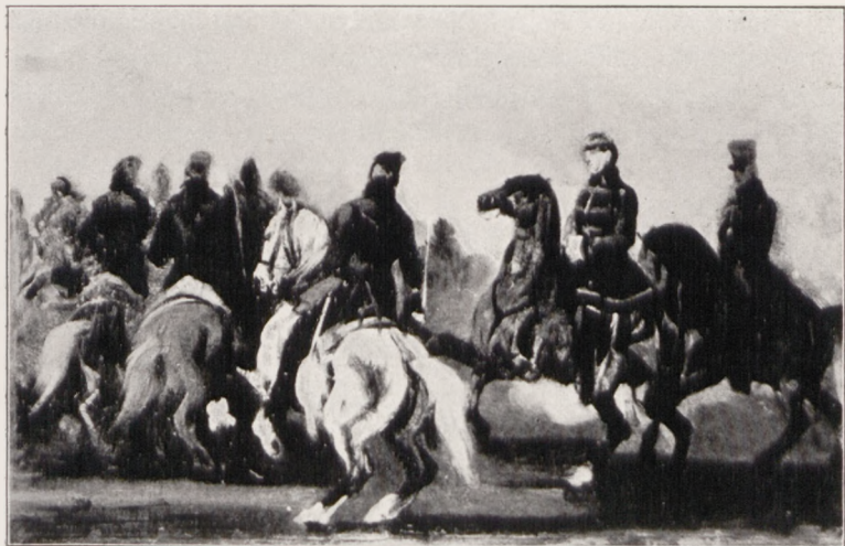
Piotr Michałowski: „Jeźdźcy“.