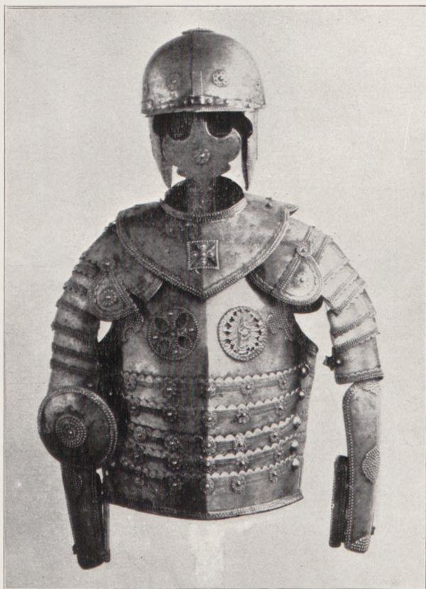
Zbroja polska z XVII. w.

udzielenia zgodnie z uchwałą Rady bezpłatnych raz w rok wstępów każdej klasie ludowych szkół miejskich, z drugiej też okoliczności, iż Dom Matejki położony w ulicy ruchliwej i przemysłowej ginie zupełnie w szeregu zwykłych czynszowych kamienic. Komitet Mu-