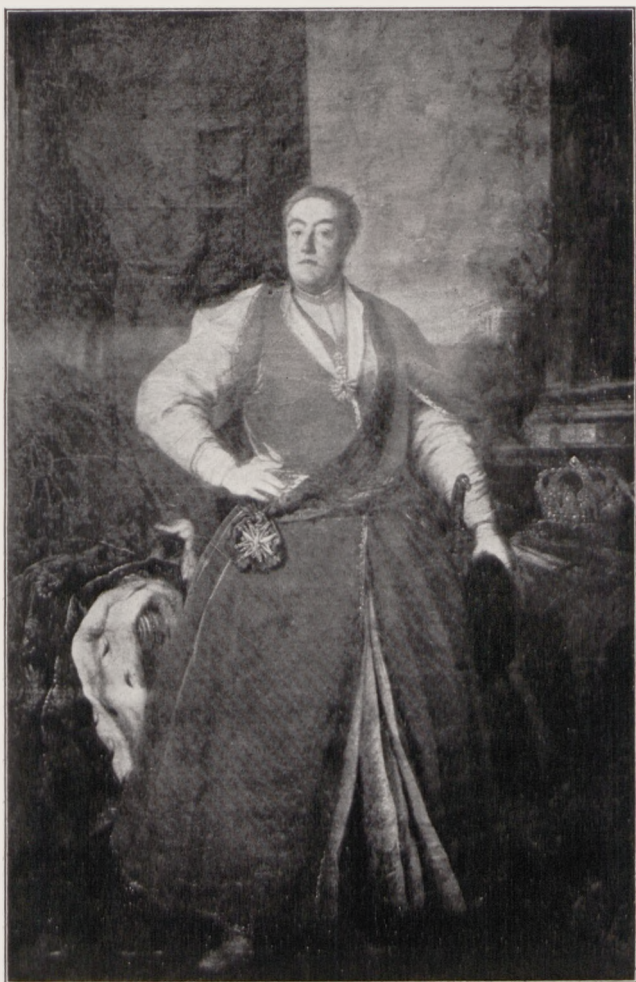
Artysta nieznaný: „Portret Augusta III“.

znajduje się w posiadaniu Muzeum narodowego. Niestety restauracja tych zabytków nie może postępować w tak szybkim tempie i być prowadzona w tak szerokim zakresie, jakby należało, tak ze względu