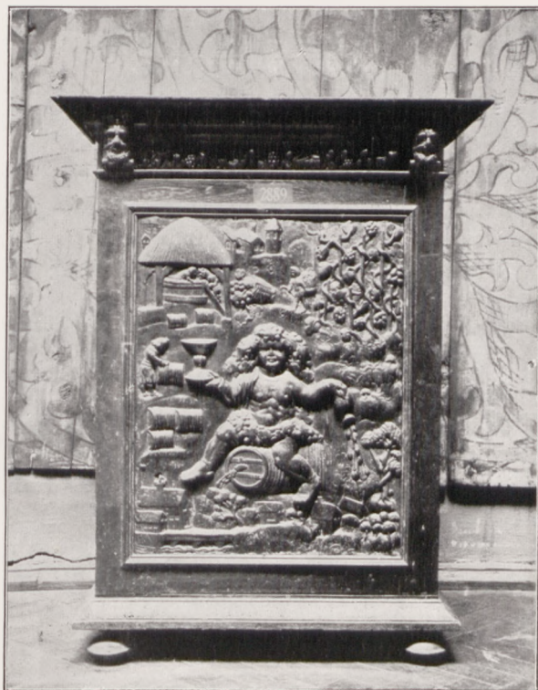
Szafka z alegoryą jesieni.