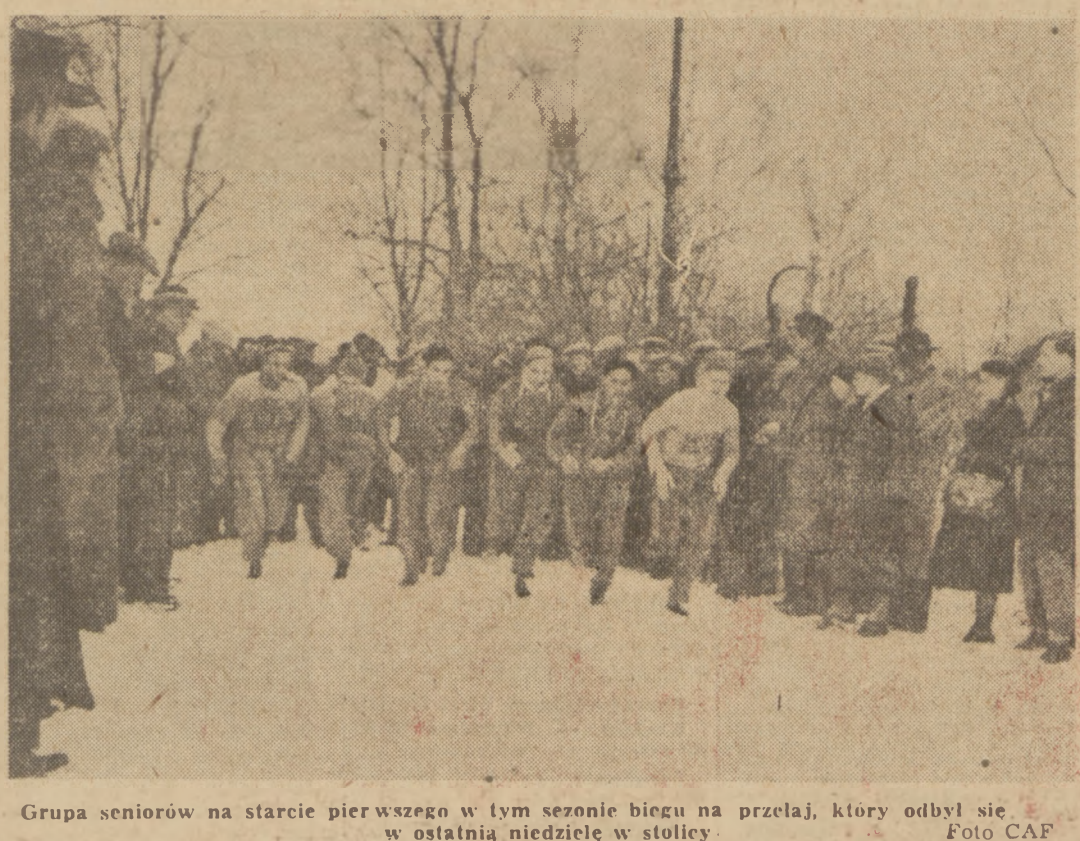
Grupa seniorów na starcie pierwszego w tym sezonie biegu na przelaj, który odbył się w ostatnią niedzielę w stolicy.

Kobiety 100 m 12,8 12,6 12,1 200 m 26,8 26,0 25,2 400 m 62,0 60,0 58,0 800 m 2,30 2,24 2,19 80 m pl. 12,9 12,8 11,8 150 m 1,47 1,50 1,58 500 m 5,20 5,45 5,65 110 m 11,80 12,50 13,00 400 m 35,00 38,00 41,50 1000 m 36,00 39,00 42,00 4x100 4,10 4,15 4,15 4x400 3,18 3,10 3,15