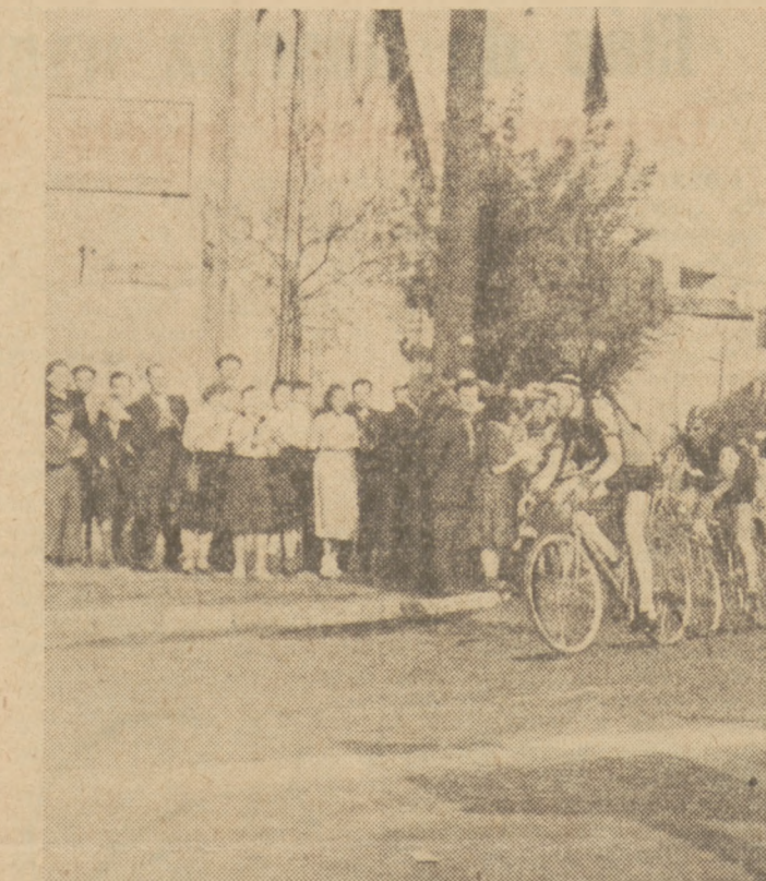
W miasteczkach i we wsiach długi sznur zawodników — uczestników Wyścigu Pokoju witaly tłumy ludzi...