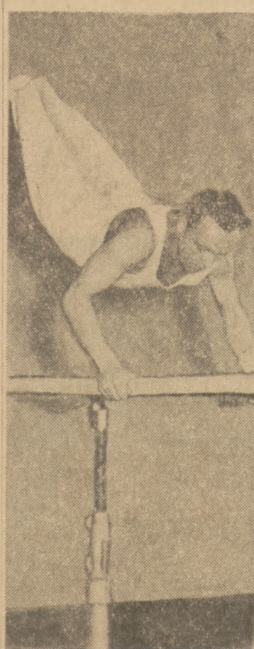
Ferenc Pataky — mistrz olimpijski i zwycięzca międzynarodowego turnieju w Budapeszcie podczas ćwiczeń na poręczach.