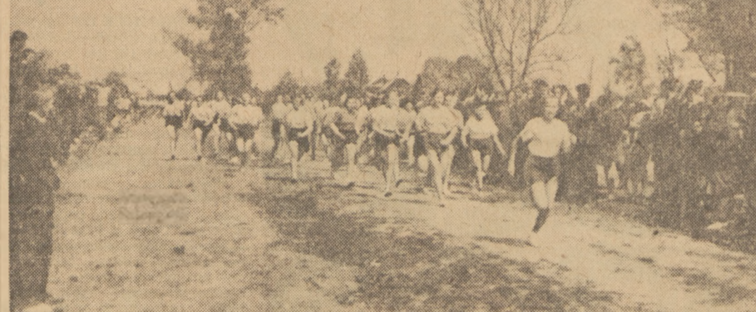
Grupa Juniorek z Bielska Podlaskiego na finiszu Biegu Narodowego

Podsumowaniem obrad okazał się wydziałowy raport z komisji, w którym wskazano na konieczność wprowadzenia szeregu zmian w dotychczasowych przepisach.