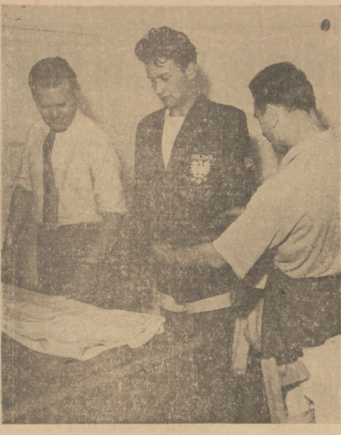
Oto jak wyglądają nowe ubrania naszych olimpijczyków. Marynarka Twardokensa wymaga już tylko drobnej poprawki.