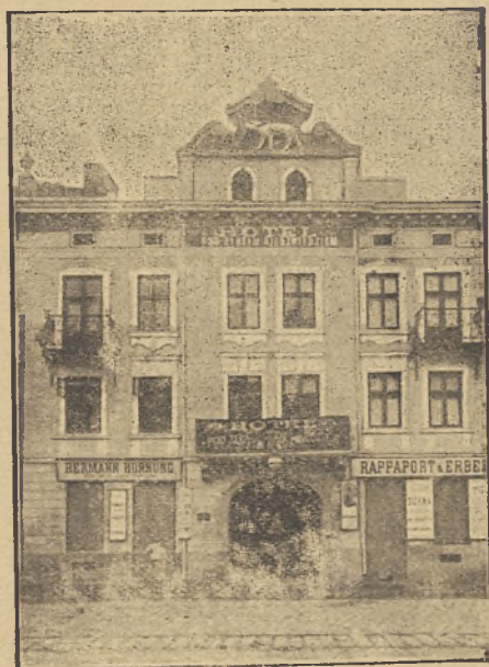
LEMBERG Kaźmierzowska Nr. 3.

איך בעעהרע מיך מיינען פ. מ. קונדען העפל. מיטצוטהיילען, דאס איך מיינע בוכדוקערייא מיט דען מאָדערנסטען העברעאישען שריפטען פֿערזעהען האבע, אונד זאָוואָהל ווערקע, וויא אויך צייט- שריפטען, פֿערנער אללע מאָגליכען בוכדוקערייא-אַרבייטען עלעגאנט אונד צו מאַססיגען פֿרייען אויספֿיהרע.