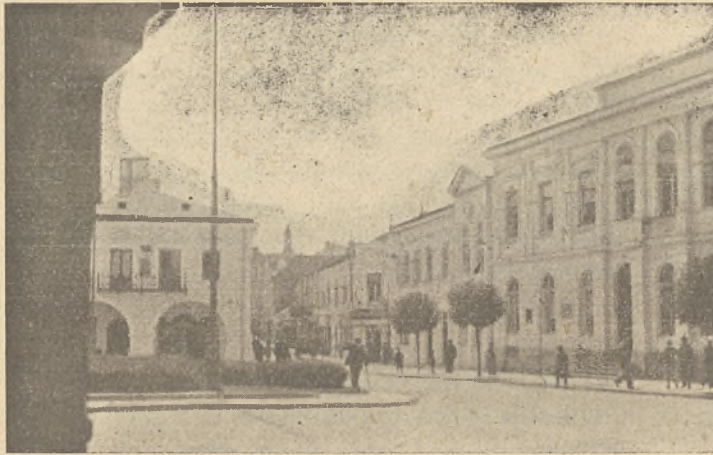
Kielce, Plac Marszałka

— Moim zdaniem — stwierdza dyr. Axentowicz — chaotyczna, bezplanowa „inwazja” rzemiosła na teren Centralnego Okręgu nie jest pożądana. C. O. P., obok wykwalifikowanego rzemieślnika dla zakładów przemysłowych potrzebuje również rzemieślnika samodzielnego ale mogą tu wchodzić w grę jedynie jednostki, które obok wysokich