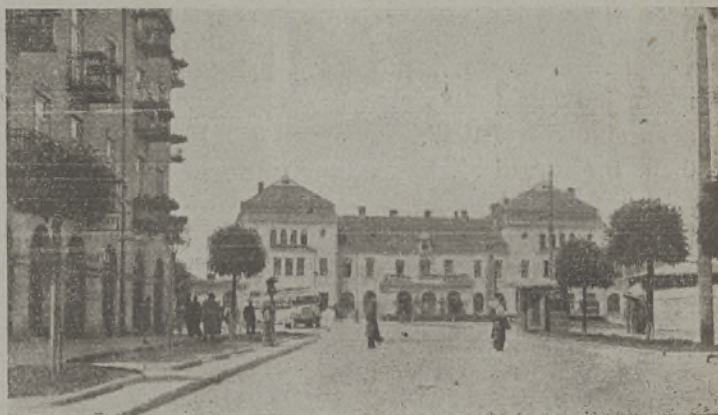
Kielce, Dworzec Główny