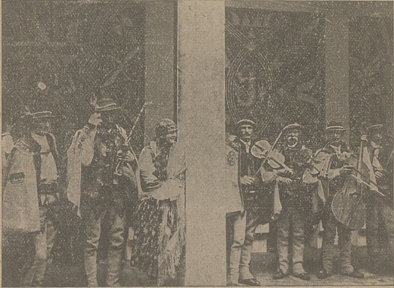
Orkiestra naszych górali tatrzańskich na wystawie dekoracyjnej w Paryżu.