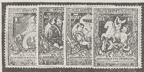
Nr. 1829 Michel 100/104