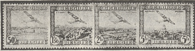
Nr. 409 c