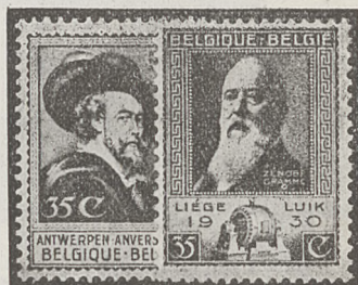
Nr. 409 a