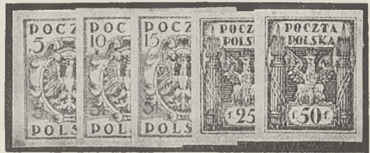
Nr. 1662 Wystawa cięte " 1663 " ząbk.