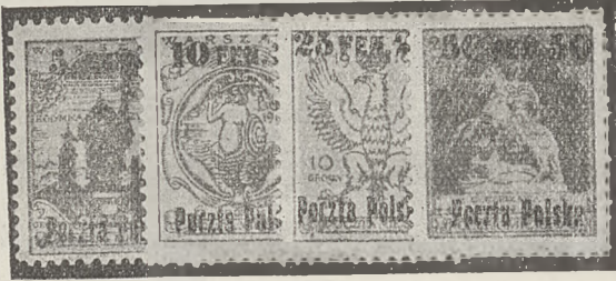
Nr. 1647 a