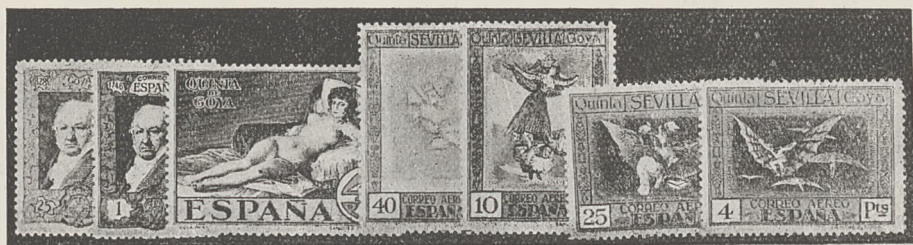
Nr. 997 Jub. Goya kpl. 32 egz.