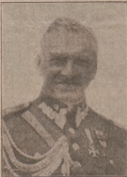
Minister Spraw Wewn. General Składkowski.

Na czele tego działu umieszczamy podobiznę siewcy „czystości” w kraju w najdobitniejszym znaczeniu tego słowa.