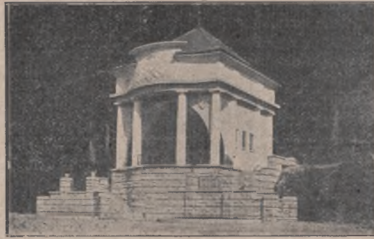
Muszla orkiestry w Krynicy.

(przeszło 600 m. ponad poziom morza), jest jednocześnie uzdrowiskiem leczniczym. Cudownie działające kąpiele gazowe, wydobywane z głębi ziemi, świetne źródła wód mineralnych, o różnorodnym i bogatym składzie chemicznym, przewyższające niejednokrotnie zachwalane i znane źródła zagraniczne — stwarzają warunki wyjątkowe dla Krynicy, w której można połączyć odpoczynek w rzeźkiem górskim powietrzu wraz z leczeniem różnych chorób, które każdy w pewnym wieku w organizmie swym hoduje. Długim ważnym względem, dzięki któremu Krynica przewyższa Zakopane zamą, jest klimat. Halnych wiatrów, tak niespodziewanie spadających na Zakopane i pożerających w oczach śnieg — niema tu wcale, to też dla sportów zimowych Krynica jest miejscowością wprost wymarzoną. Najlepszym dowodem ubiegły właśnie okres świąteczny, w którym bez przerwy w ciągu dwu tygodni odbywały się w Krynicy krajowe i międzynarodowe zawody hokejowe, przy świetnym stanie lodu. Odwilż trwała przez jeden zaledwie dzień. Te specjalne warunki, jakie posiada Krynica dla rozwoju sportów zimowych, predestynujących ją na polskie St. Moritz — wykorzystuje energicznie zarząd państwowy uzdrowiska, zakładając coraz to nowe inwestycje w tej dziedzinie. Tak więc na wprost Zakładu Zdrojowego stanęła imponująca skocznia narciarska wybudowana najdłuższy w Polsce 1300 metrów tor saneczkowy i buduje także bobslejowy, ukończono doskonale tor ślizgawkowy, w projekcie jest wieki stadion sportowy — jed-