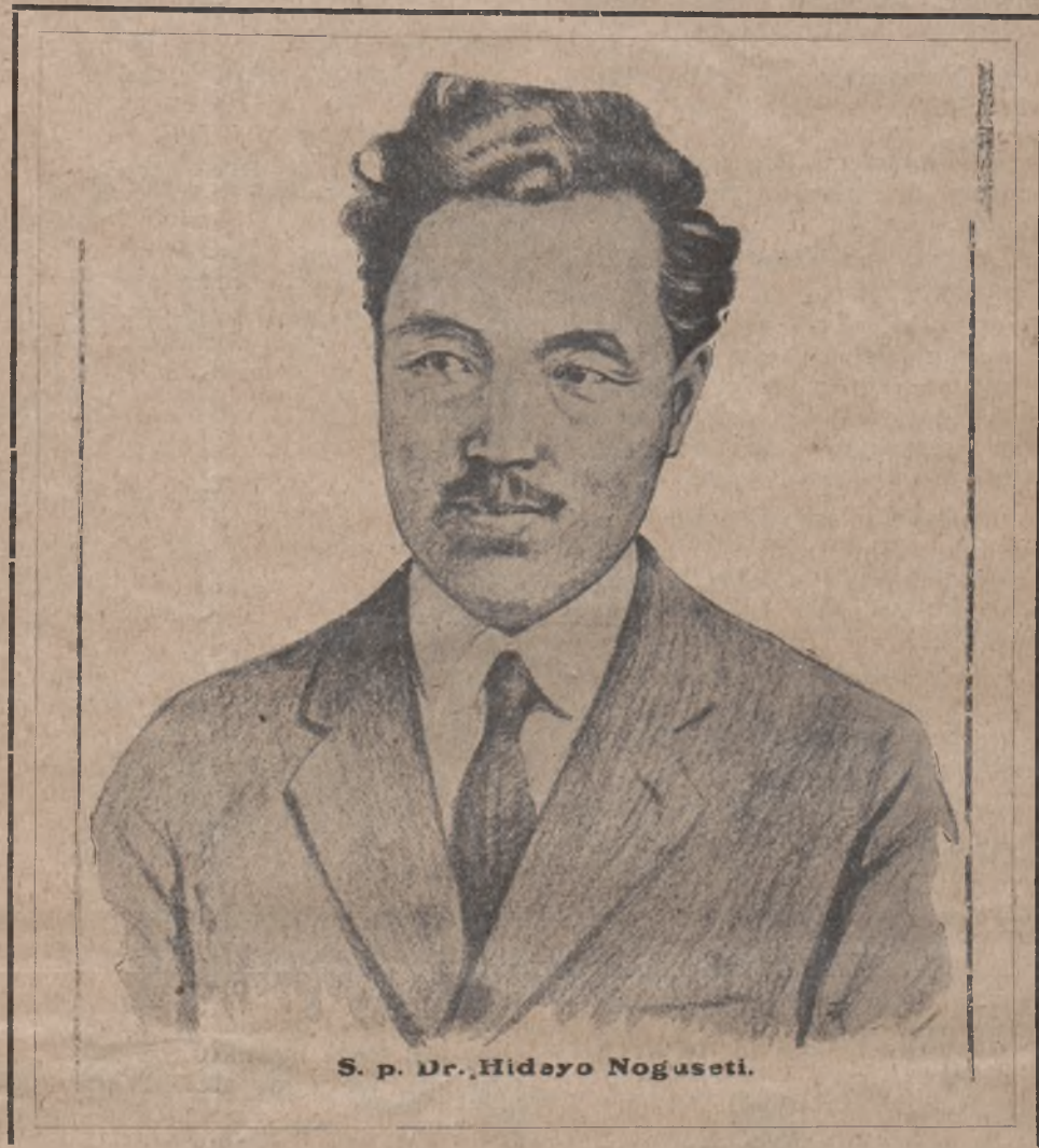
S. p. Dr. Hideyo Noguseti.

Czyn ten godny naśladowictwa zasługuje tem więcej na wyróżnienie, że był on, niestety w powiecie odosobnionym.