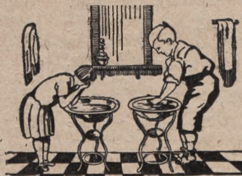
Fig. Nr. 2.