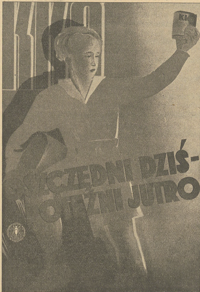
Tarcza do kalendarza ściennego.

Zadania polskich kas bezprocentowych są trójakiego rodzaju: 1) pobudzenie inicjatywy prywatnej mas bezrobotnych lub elementów zdeklasowanych do