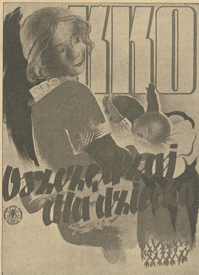
Tarcza do kalendarza ściennego.

W roku sprawozdawczym Bank udzielał kredy-