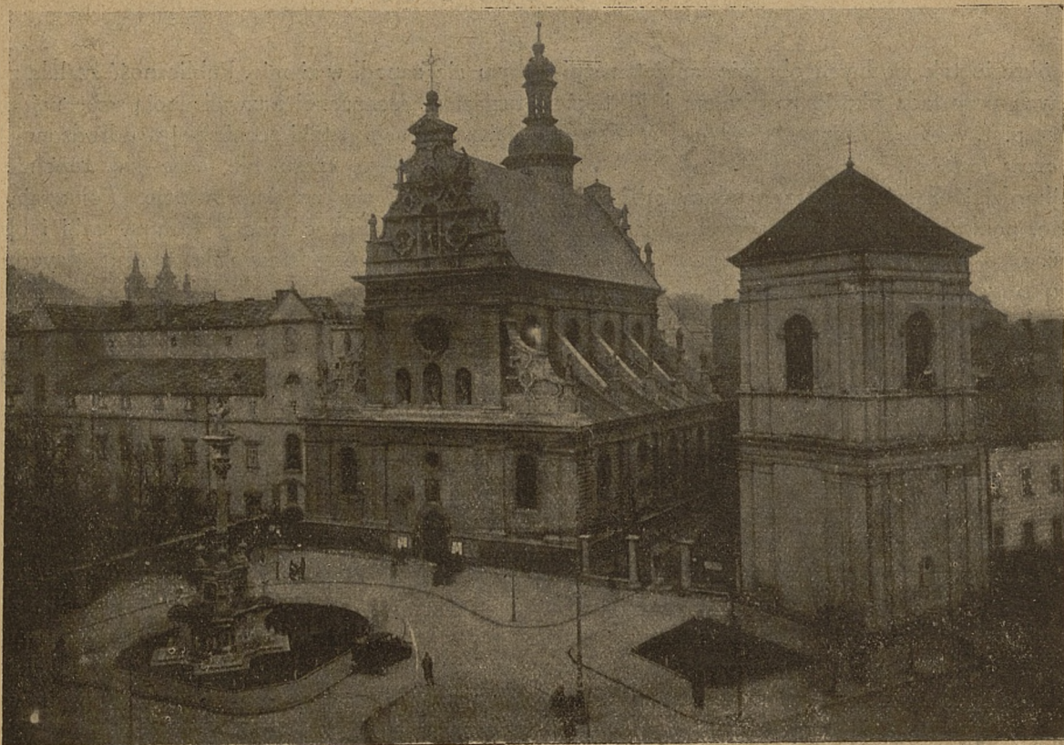
Plac przed kościołem OO. Bernardynów po regulacji.