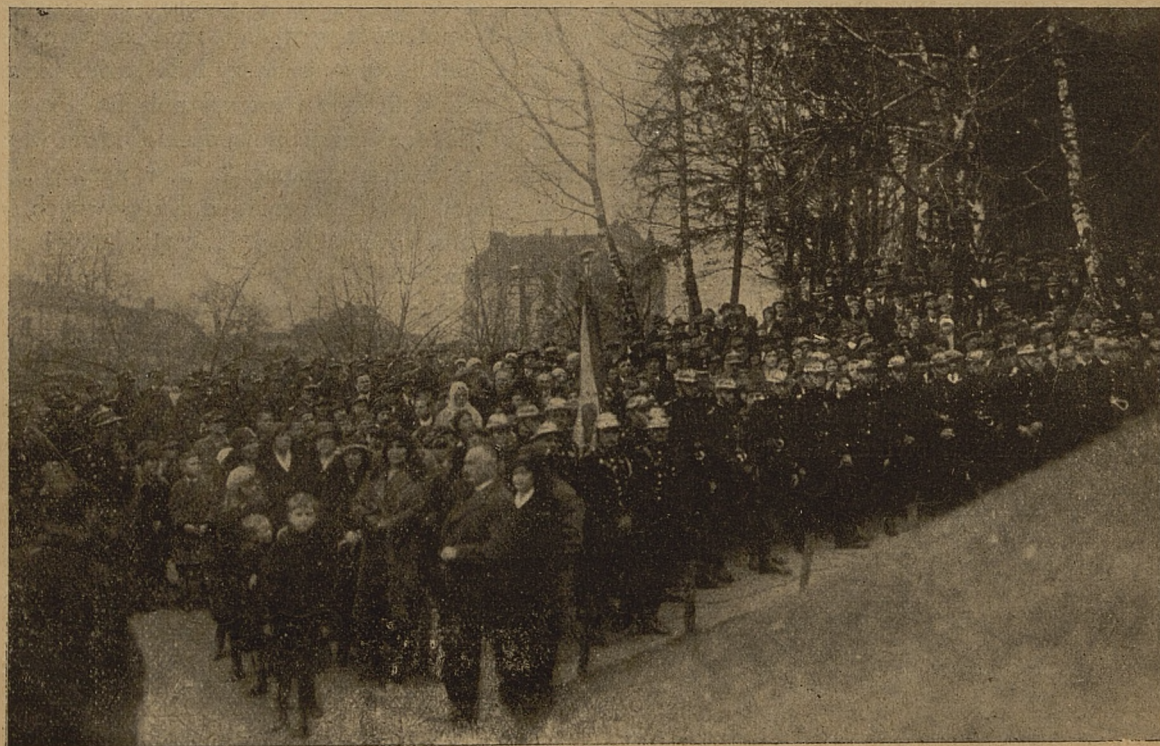
Uroczysty obchód rocznicy bitwy Raławickiej pod pomnikiem Bartosza Głowackiego we Lwowie.