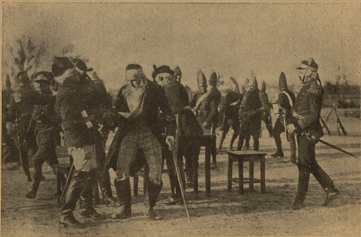
Scena z arendarzem.

Staraniem woj. komitetu obchodu rocznicy 3 Maja odbędzie się we wtorek na Jałowcu widowisko ludowe pod gołym niebem, pod dyrekcją art. dram. Leszczyca i Nawrockiego.