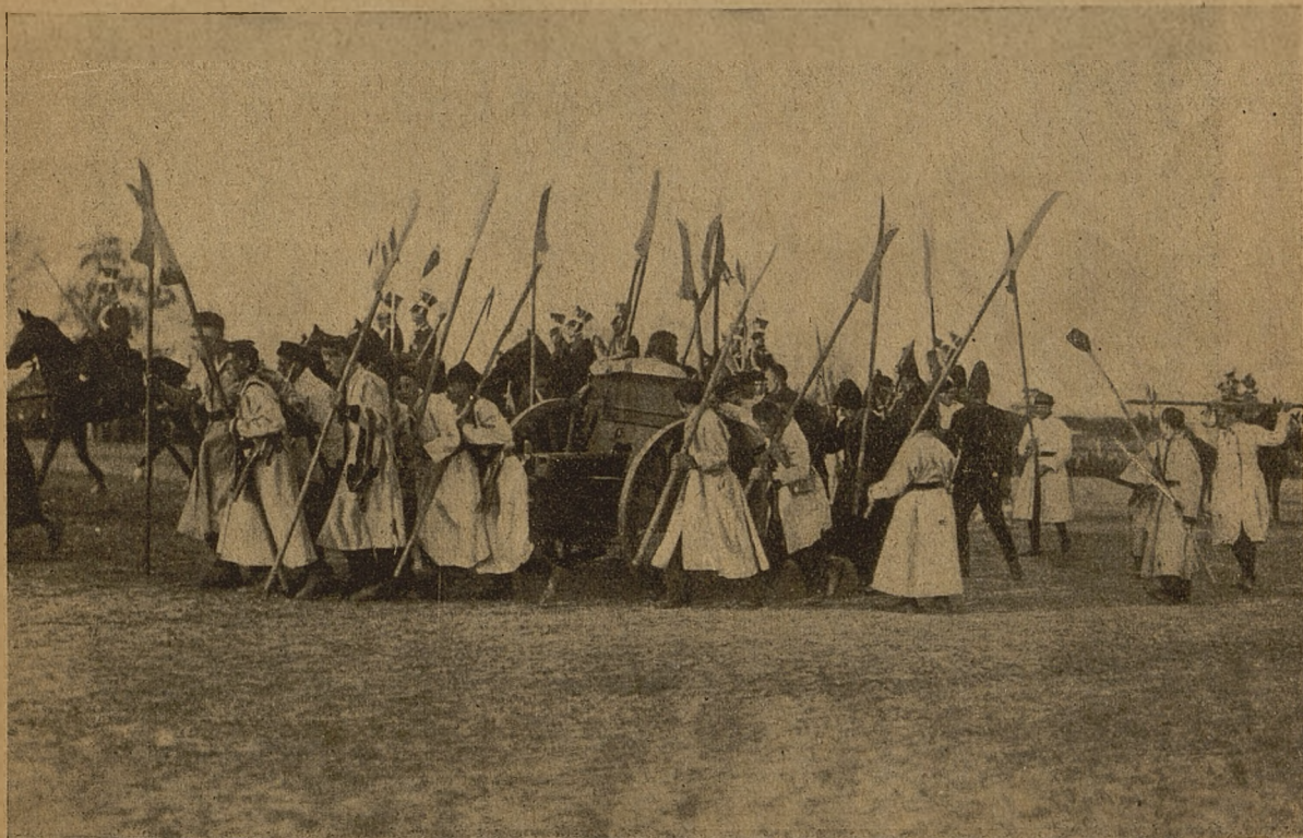
Kosynierzy Głowackiego przy zdobytej armacie.