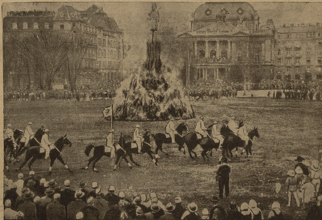
Miasto Zurich starym zwyczajem obchodzi święto, symbolizujące zwycięstwo wiosny nad zimą. Wokół palącej się kukły ze słomy odbywają się tańce i harce na koniach.