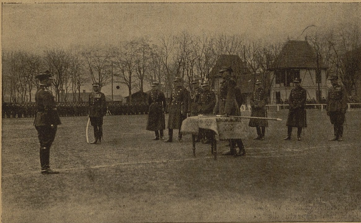
Uroczyste wręczenie dywizyjnego proporca strzeleckiego 19 p. p. we Lwowie, za tegoroczne mistrzostwo w strzelaniu.