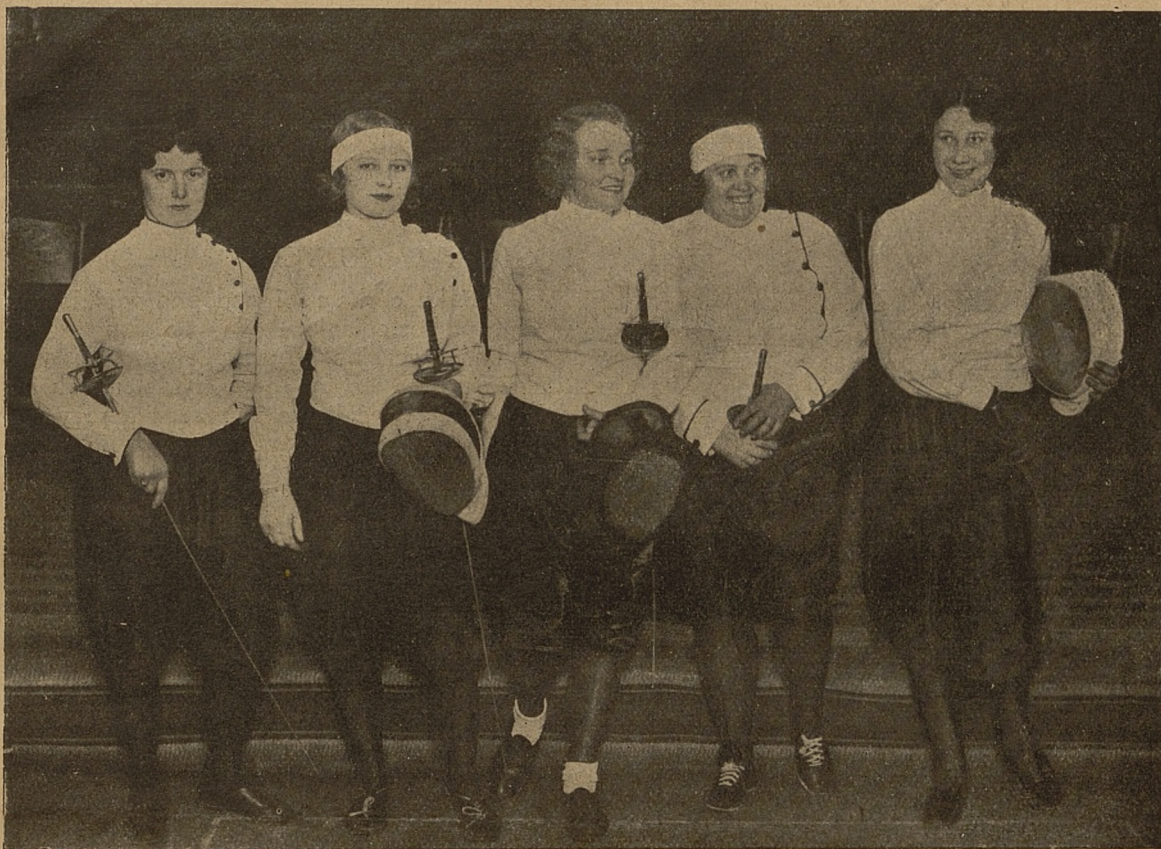
Zawody pań we florecie do mistrzostwo miasta Lwowa.