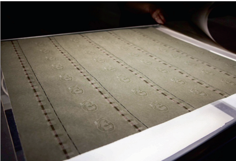
Рис 7. На Фабрике банкнотной бумаги НБУ. 28

Не все государства мира могут похвастаться полностью завершенным циклом производства – наличием фабрики банкнотной бумаги и банкнотно-монетного двора. Фабрика банкнотной бумаги выполняет немало заказов в Украине – бумага для