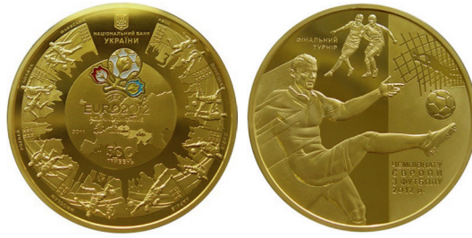
Рис 11. Фото: Серия «Спорт». Финальный турнир чемпионата Европы по футболу в 2012 г. Национальный банк Украины 38

Созданием отечественной монетной продукции на всех этапах занимаются профильные специалисты, в обязанности которых входит проектирование, конструирование, моделирование монет и внедрение художественных технологий из их отделки (инкрустации, состаривания металла, локальной позолоты, голограммы, тампопечати и т.д.) 39 .