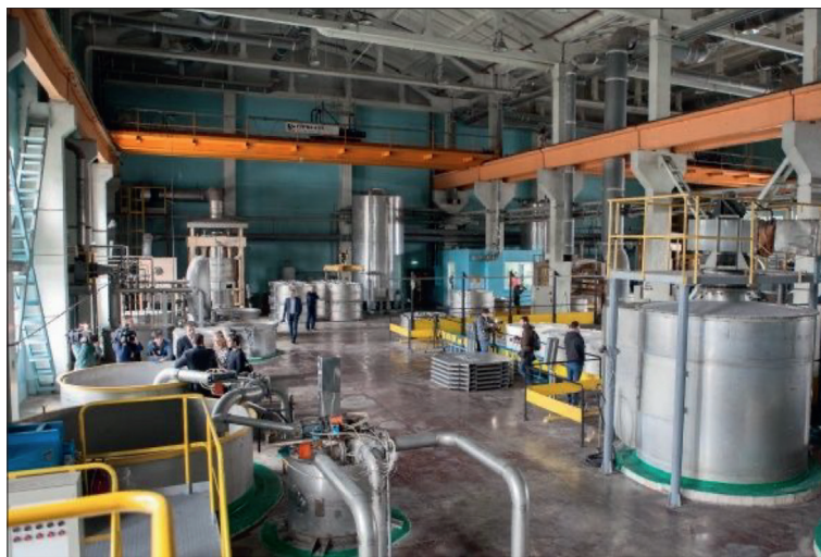
Рис 5. Фабрика банкнотной бумаги НБУ. 27

Готовые листы бумаги упаковывают и отгружают на Банкотно-монетный двор. Практически все процессы на производстве автоматизированы.