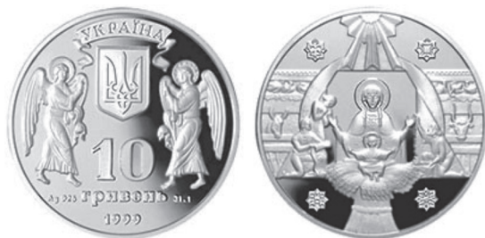
Рис 12. Фото: Серия «2000-летие Рождества Христова». Национальный банк Украины 41

во» признана лучшей монетой года в мире в номинации «Самая вдохновляющая монета».