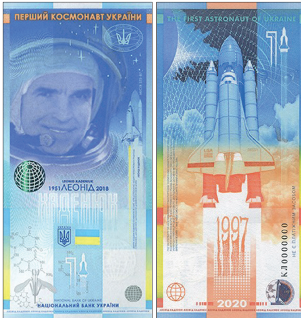
Рис. 10. Сувенирная банкнота «Леонид Каденюк — первый космонавт независимой Украины». Национальный банк Украины. Дата введения в оборот: 26 ноября 2020 36