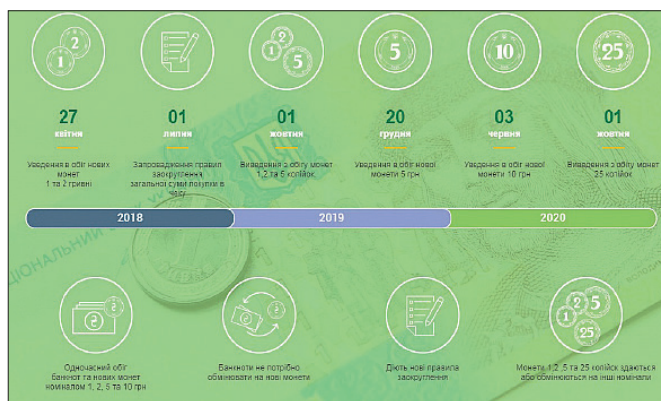
Рис. 9. Инфографика Национального банка Украины 35

Монетный двор введен в эксплуатацию в 1998 году. В соответствии с Указом Президента Украины «Об исключительном праве Банкотно-монетного двора Национального банка Украины» от 10 сентября 1996 г. 34 Банкотно-монетному двору (далее: БМД) было предоставлено исключительное право на осуществление деятельности относительно обеспечения потребностей НБУ в банкнотах и монетах массового обращения. Благодаря этому наше государство имеет полностью завершённый цикл производства.