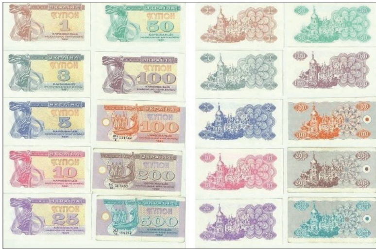
Рис. 2. Купонно-карбованцы 12

Печатать эти купоны в Украине было негде, поэтому, как и во времена УНР, пришлось искать помощь за рубежом. Национальный банк Украины (далее: НБУ), заключил контракт на изготовление купонов с французской компанией «Imprimerie Speciale de Banque» и британской фирмой «Thomas De La Rue Company Limited» 13 .