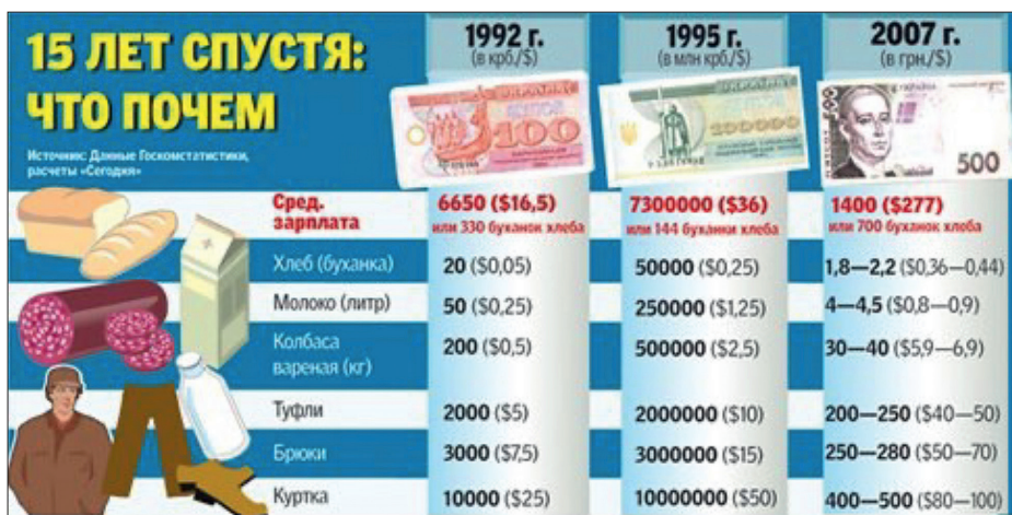
Рис.3 Покупательная способность населения Украины 15