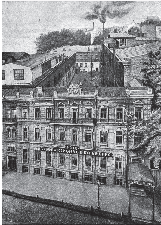
Рис 1. Здание типографии Кульженко в Киеве, где в декабре 1917 г. методом литографического печати изготовили первые украинские деньги. Также здесь печатали почтовые марки Украинского Государства и УНР 4

Такой шаг был связан с необходимостью улучшения качества и степени защищенности украинских денег, которое обеспечивала печатная база немецкого государства. Одновременно не прекращалась печать денежных знаков в Украине. Наряду с этим проводились мероприятия по созданию собственной высококачественной технической основы для производства денег, в которых главное место занимала Экспедиция заготовок государственных бумаг (Э.З.Г.Б.) 5 . В Германии проводились закупки оборудования для украинского монетного двора, который в силу неблагоприятных обстоятельств так и не был до конца сформирован 6 .