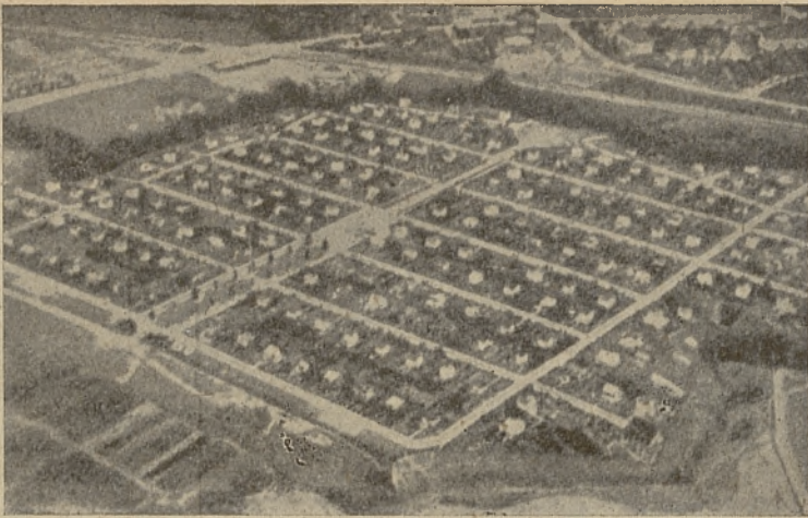
Norweski ogródek działkowy pod Oslo.

kowych i osiedli wcale nie najwspanialszy! Düsseldorf, Bonn, Freiburg w Brezgowii i inne miasta na szlaku nadreńskim ku Szwajcarii, a następnie od Saarbrücken przez zagłębie Saary na Heilbronn, Norymbergę, Kamieniec, Drezno, Wrocław, Bytom, wszystkie wymienione i niewymienione miasta i miasteczka tych dwu szlaków mają całe potężne zieleńce nie tylko z parków i ogrodów, ale z ogródków działkowych przede wszystkim, przetkanych jak wzorzysty kobierzec osiedlami, czasem blokami, które jednak też posiadają swe ogródki. Z przyjemnością stwierdziliśmy, że Kraków wcale nie pozostaje w tyle za miastami niemieckimi. Skoro uruchamia już czwarty ogród działkowy, ma przy blokach ogródki i co najważniejsza, wyznaczył już miejsce pod osiedle z ogródkami!