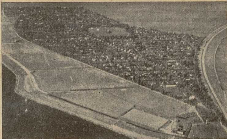
Holenderski ogródek działkowy pod Amsterdamem.

kom społeczeństwa i obywatelskiemu nastawieniu urzędników Funduszu Pracy, ale na prowadzenie akcji ogródków działkowych trzeba tego samego,