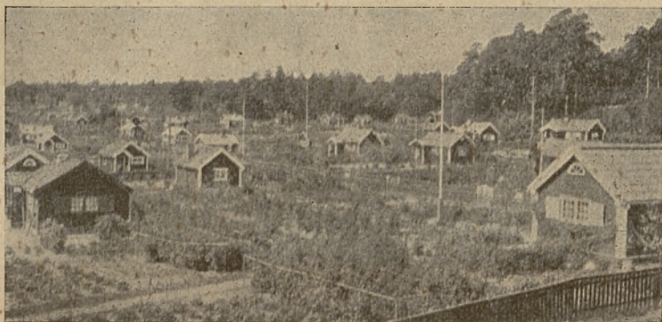
Ogródek działkowy w Szwecji.

znaczenia ogrodnictwa dla polityki ludnościowej. W niemieckim ogrodnictwie zawodowym 88% przedsiębiorstw to małe i najmniejsze przedsiębiorstwa. Prowadzą je przeważnie