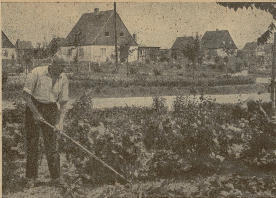
Niemieckie Osiedle i praca w ogródku.