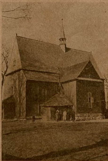
Kościółek św. Bartłomieja w Mogile.

z drzewa, kryta strzechą. Długość przeciętna wynosi 21 m, szerokość 7 m, a wysokość 8 m. Dom taki podzielony jest na kilka części. Lewe skrzydło zajmują pomieszczenia mieszkalne z wejściami od sieni. Za nią ku stronie prawej mieści się stodoła, potem stajnia, wreszcie do lewej strony domu przybudowana jest wozownia. Wejścia do wszystkich części takiej chałupy prowadzą z sieni oraz z wozowni. Pewnego rodzaju odmianą takiego domu są t. zw. czworaki dworskie. Wymiary czworaków: 35 m długości, 8 szerokości i wysokości 9 m. W Mo-