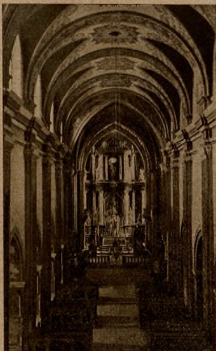
Wnętrze klasztoru O. O. Cystersów w Mogile.

Niewątpliwie i w pięknych obchodach ludowych znać w Mogile wpływ miasta. Nie mniej jednak lud stara się zachować tradycję, przynajmniej w liturgicznych obchodach, które stają się świętem ogółu. Najlepiej będzie, jeżeli przejdziemy chronologicznie miesiącami kalendarzyk obchodów: