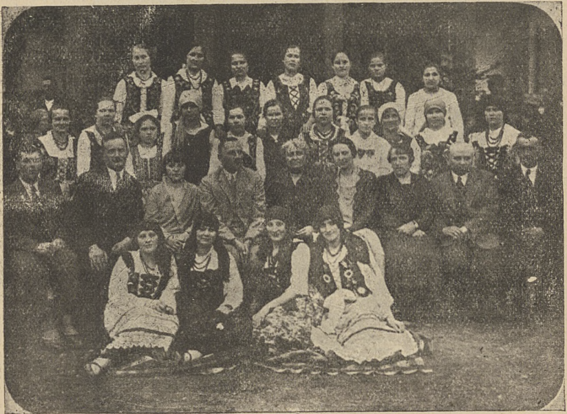
Kurs gospodarstwa domowego w Sieniawie 1. I. 31. III. 1928