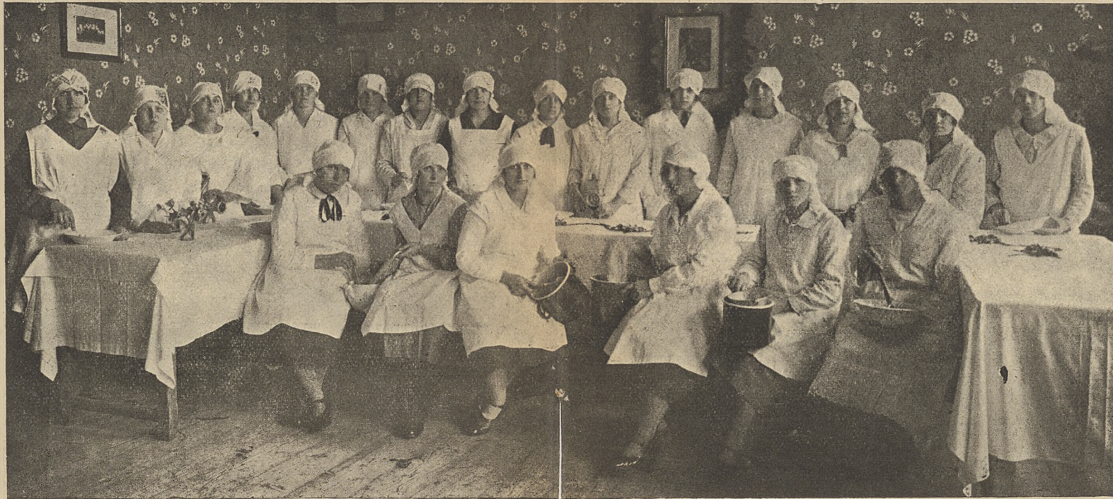
Kurs gotowania w Andrychowie 1928

wych Stowarzyszeń. Koszta kursów powyższych pokrywał Sekretarjat i dotyczące Stowarzyszenia po połowie.