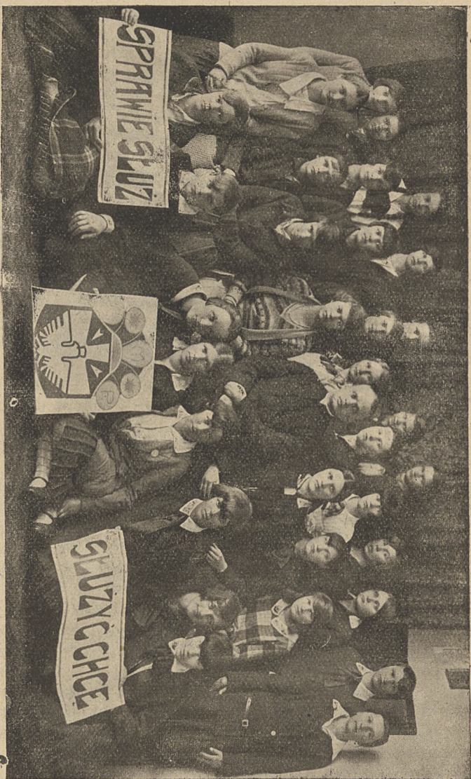
Kat. Stowarzyszenie Młodzieży Żeńskiej w Zakopanem.