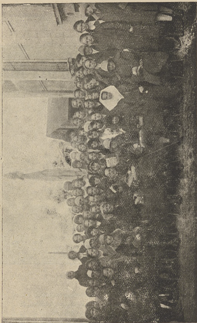
Kurs instr. dla Wydziałów w Trzebini 25 i 26 lutego 1928

3. Kursy organizacyjne dla Wydziałów. Celem pogłębienia strony organizacyjnej i ideowej, jak również rozwinięcia samodzielności Stowarzyszeń przy wypełnianiu przez nie zadań statutowych, urządził Sekretariat jen. i przeprowadził w roku sprawozdawczym 2 kursy orga-