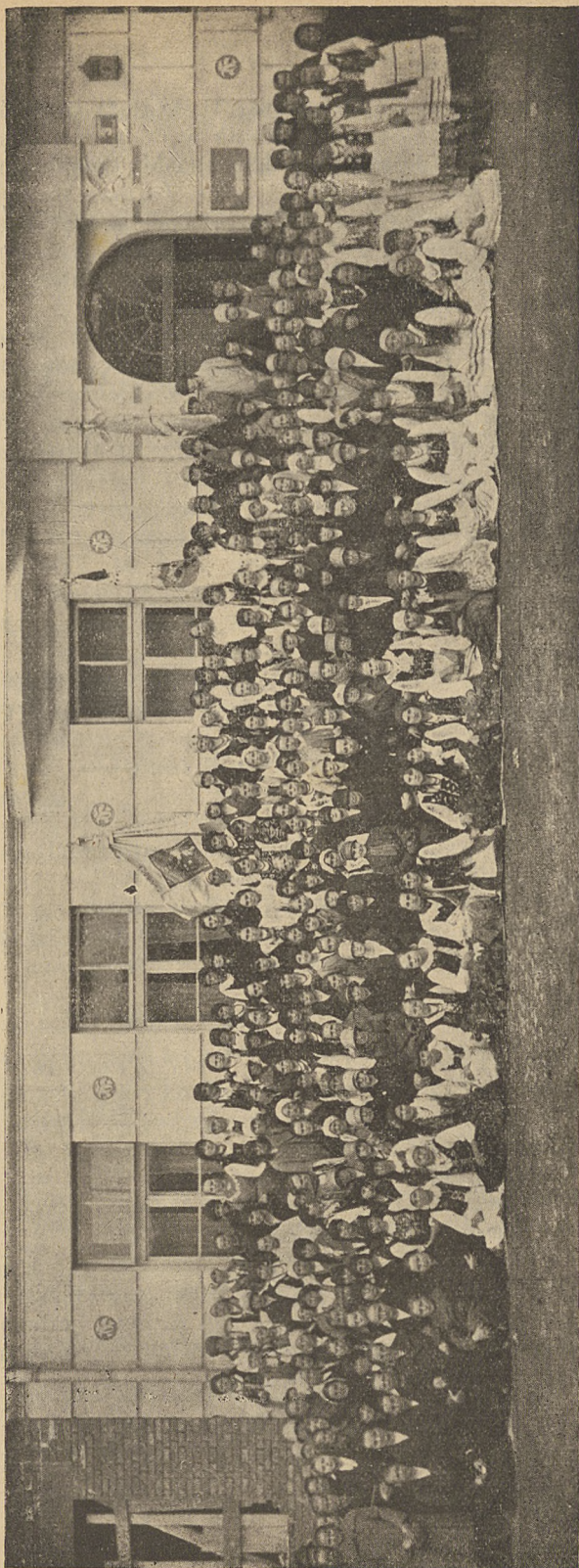
Zjazd Delegowanych dnia 14 i 15 kwietnia 1928 r.