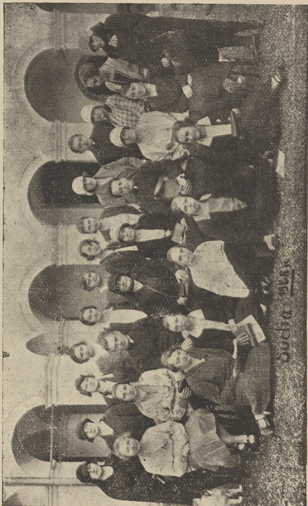
Uczestnicy kursu instr. dla WP. Dyrektorek w Suchej 1928

Związek krakowski przeprowadził w roku sprawozdawczym dwa konkursy: zjednoczeniowy na kukurydzę, i związkowo-okręgowy na buraki.