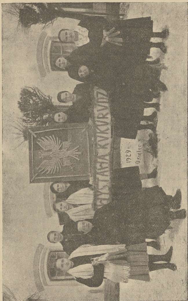
Konkurs kukurydziany w Osielcu.

Sąd konkursowy przy Związku przyznał następujące nagrody: I nagroda — 100 zł. — Stowarzyszeniu w Sułkowicach, II nagroda — 70 zł. — Stowarzyszeniu w Leńczach, III nagroda — 60 zł. — Stowarzyszeniu w Izdebniku. Stowarzyszenia w Przytkowicach, Jasienicy