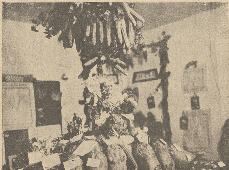
Powiatowa wystawa p. r. w Liszkach.