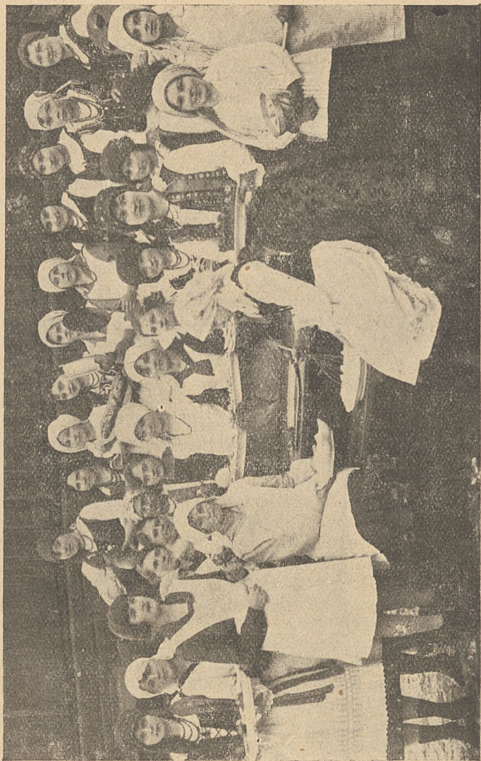
Kurs gotowania S. M. P. w Sulkowicach.