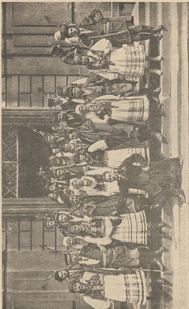
Młodzież Związku krak. w Pradze na uroczystościach Świętowaclawowskich.

Na tem miejscu należy jedynie podkreślić, że konkursy p. r. wśród młodzieży nie mogą być traktowane, jako zabawka — bo niestety i takie zdanie da się słyszeć od osób nawet fachowo pracują-