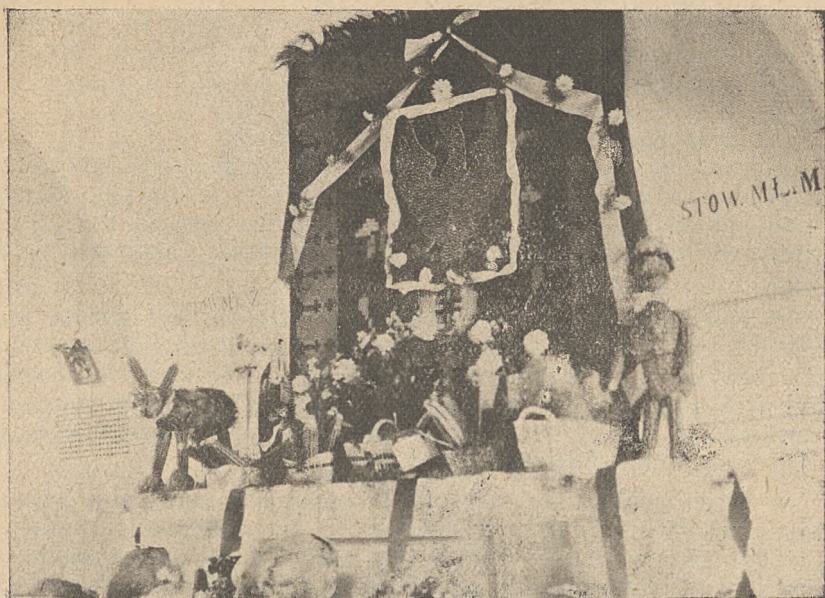
Powiatowa wystawa p. r. w Liszkach.