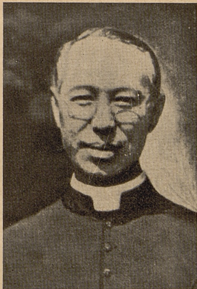
E. Mons. Petrus Doi Taisno novus Archiep. Tokiensis

Cardinalis Segura, archiepiscopus Sevilleae omnia documenta de vita, tum sacerdotum, qui a communistis occisi sunt, tum etiam eorum, qui in carcere detenti persecutionem patiuntur, conquerere sibi proposuit, ut posteri vitam eorum prae oculis habentes, vitam suam sic instituerent, ut ea omnia, quae patriae nociva essent, vitarent. Iam ho-