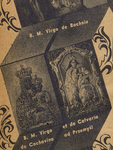
B. M. Virgo de Cochavina et de Calvaria ad Przemyśl