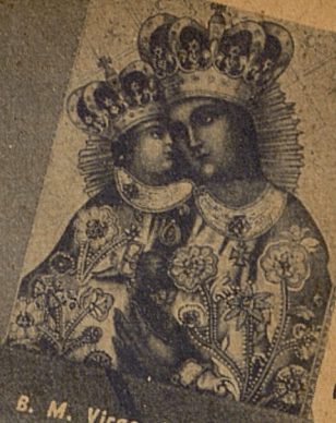
B. M. Virgo de Calvaria Zebrydoviensi