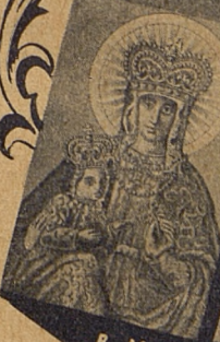
B. M. Virgo de oppido Troki