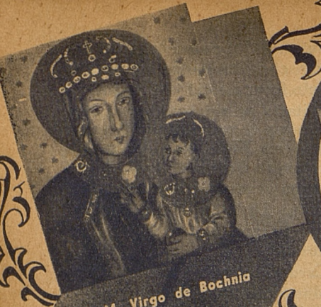
B. M. Virgo de Bochnia