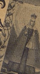
B. M. Virgo Codensis