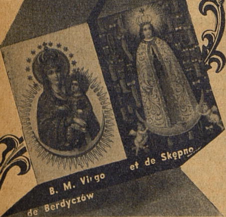
B. M. Virgo de Berdyczów et de Skępno