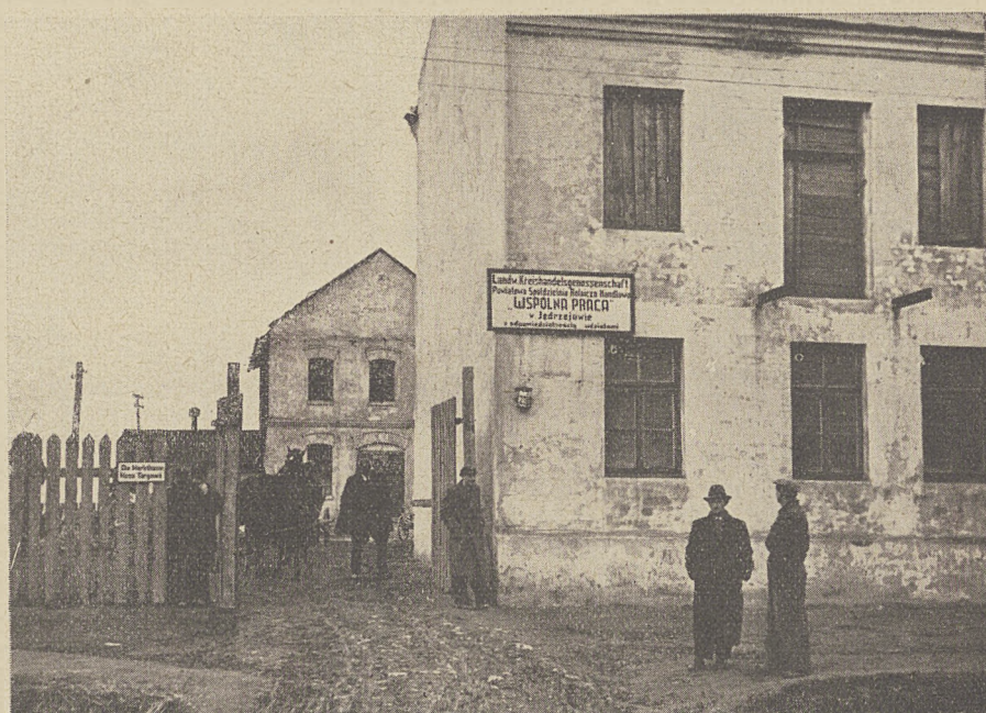
Magazyny i zabudowania gospodarcze Powiatowej Spółdzielni Rolniczo-Handlowej w Jędrzejowie

Do tego celu powołane są organizacje handlowe, któ-