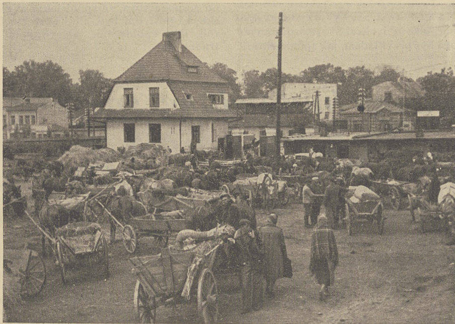
Obejście Powiatowej Spółdzielni Roln.-Handlowej w Lublinie

dzielczej oraz o znacznym ruchu przystępowania rolników do spółdzielni są sprawdzianem tego, że spółdzielnie rolniczo-handlowe spełniają nie tylko rolę zbiornic towarów, które rolnik produkuje i zbywa, ale że są one również placówką rozdziału i sprzedaży towarów, sprzętu, narzędzi potrzebnych rolnikowi w prowadzeniu jego gospodarstwa domowego i rolnego. Spółdzielnia zawsze łatwiej otrzyma przydział artykułów, potrzebnych jej członkom; może zorganizować zakup nawozów sztucznych, narzędzi, skóry, zboża siewnego, sadzeniaków, zarodkowych sztuk bydła, trzody chlewnej, owiec i drobiu.