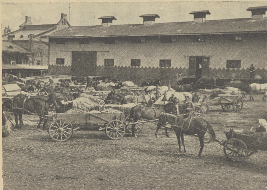
Magazyny Powiatowej Spółdzielni Roln.-Handlowej w Lublinie

W tej dziedzinie spółdzielnia może w obecnych trudnych czasach, kiedy wszystkiego jest brak, oddać niejedną przysługę swoim członkom.