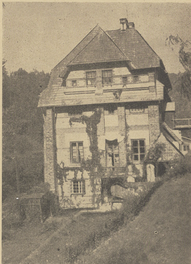
Ganek szkoły spółdzielczej w Nałęczowie

Każdy z przedmiotów kursu winien być przerobiony przez uczestnika w przeciągu 2-ch do 3-ch miesięcy. Prze-