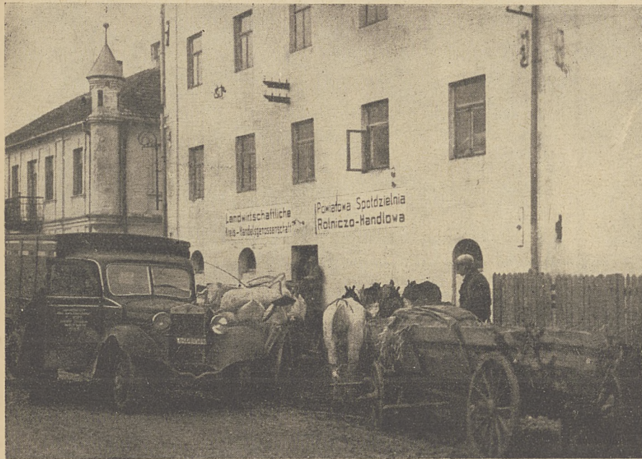
Skup zboża w spółdzielni

Obroty towarami dla rolników wynosiły w czasie od 1 stycznia do 30 czerwca 1942 roku blisko 5 1 / 2 miliona złotych, obroty zaś produktami rolnymi ponad 2 1 / 2 miliona złotych. Przy ocenie tych cyfr, zwłaszcza zaś małych stosunkowo obrotów produktami rolnymi, należy wziąć pod uwagę, że chodzi tu o półrocze pierwsze, po którym następuje dopiero pełny sezon zbioru i skupu.