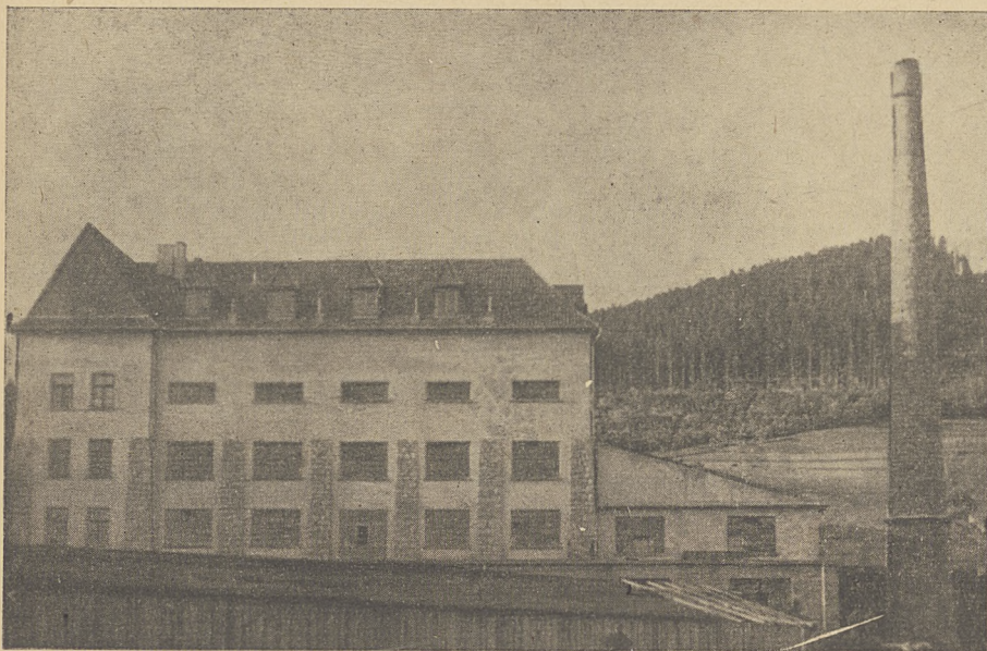
Nowa fabryka przetworów owocowych

ogólnej spowodowane wojną stawiają przetwórstwo owocowe i warzywnicze na jednym z naczelných miejsc,