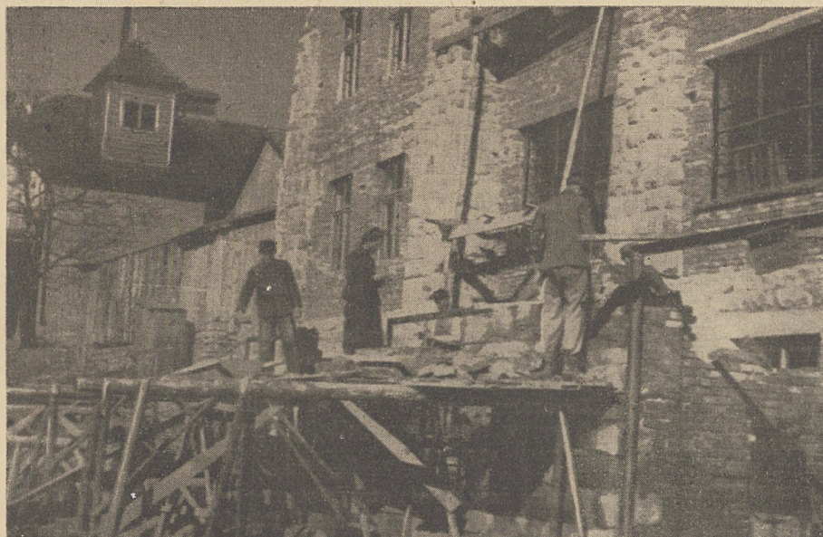
Tymbark — budowa nowej fabryki

Najważniejszym z celów sekcji sadowniczej było niewątpliwie uruchomienie szkółek drzew owocowych. Tą drogą bowiem można było dążyć do szczepienia odmian doborowych znoszących klimat podgórski i odpornych na mróz, a następnie do ściślejszego związania członków sadowników ze spółdzielnią w sensie zobowiązania ich do rzeczywistego dostarczania wyhodowanych owoców do spółdzielni. Spółdzielnia oddaje swoim członkom wyhodowane w szkółce drzewka na następujących warunkach: członek otrzymujący drzewko nie płaci za nie, stara się o najlepsze warunki dla wzrostu drzewka, a po 5, w wyjątkowych wypadkach nawet po 7 latach, zobowiązuje się dostarczyć spółdzielni po 5 kg owocu pierwszej sorty od każdego zdrowego drzewka. Szkółki drzew owocowych założono w Strzyżycu, Łososinie i Ujanowicach. W projekcie jest szkółka w Jodłowniku o obszarze 40 morgów. W bieżącym roku spółdzielnia posiada do rozdziału pomiędzy członków około 70 tysięcy drzewek. Taka akcja — to już coś znaczy. Jeżeli w dodatku zważymy, że wymagania gospodarki