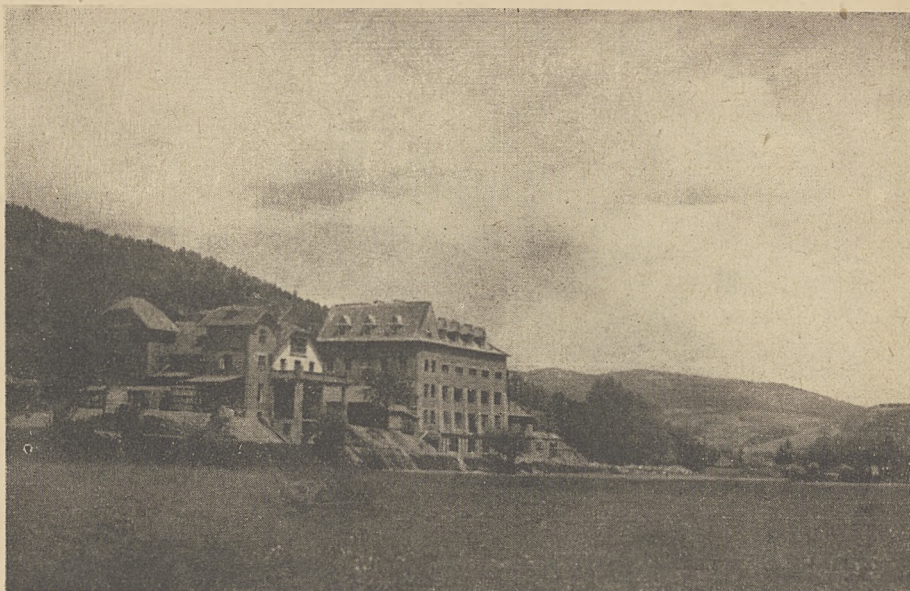
Tymbark — widok budowy nowej fabryki Po lewej stronie pierwotna przetwórczość

Z wiosną 1937 roku rozpoczęto po pokonaniu wielu trudności budowę przechowalni. Z udziałów wpłynęło 2000 zł,