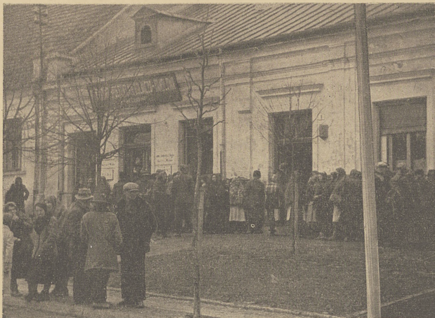
Powiatowa Spółdzielnia Rolniczo-Handlowa w Miechowie

Zasięgowi organizacyjnemu spółdzielni odpowiadają jej agendy, w których zatrudnia się 160 pracowników umysłowych oraz 70 pracowników fizycznych. Stan finansowy spółdzielni nie ulega godnym uwagi wahaniom. Kapitały własne przedsiębiorstwa wynoszą ponad 420 000, obce zaś ponad 3 800 000 złotych. Kapitał udziałowy przy 8859 udziałach wynosi 221 475 złotych.