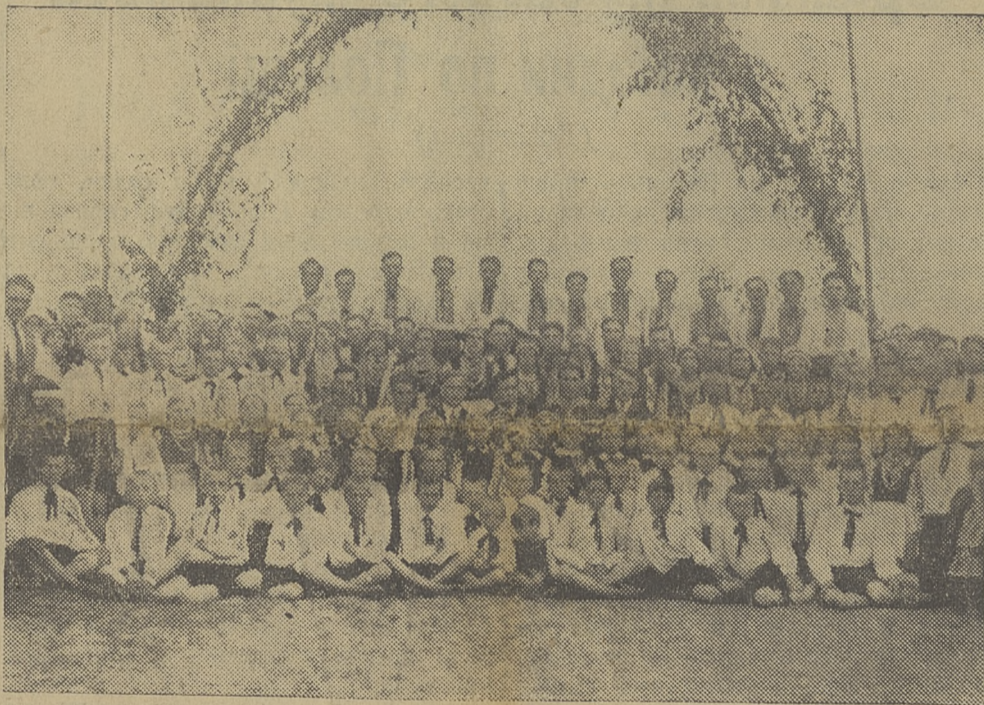
Цвіт і слава українського народу.

славові відбувається під кличем загального обєднання всіх українських сил для скріплення нашого національного життя на всіх його ділянках. Тому до співпраці в зорганізуванні цього свята Окружний Комітет Свята Молоді притягнув членів усіх наших загальнонаціональних організацій, як «Просвіта», «Рідна Школа», «Сільський Господар», Кооперація, Український Спортовий Союз, Союз Українок і інші.