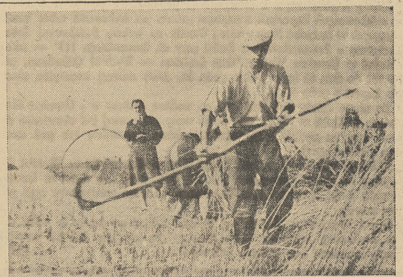
Ostatnie pokosy żyta kładą się na ziemię.

Widać, że doceniają rolę spółdzielczości na wsi, a jednocześnie dbają o swoje obory i odpowiednio je prowadzą (x)