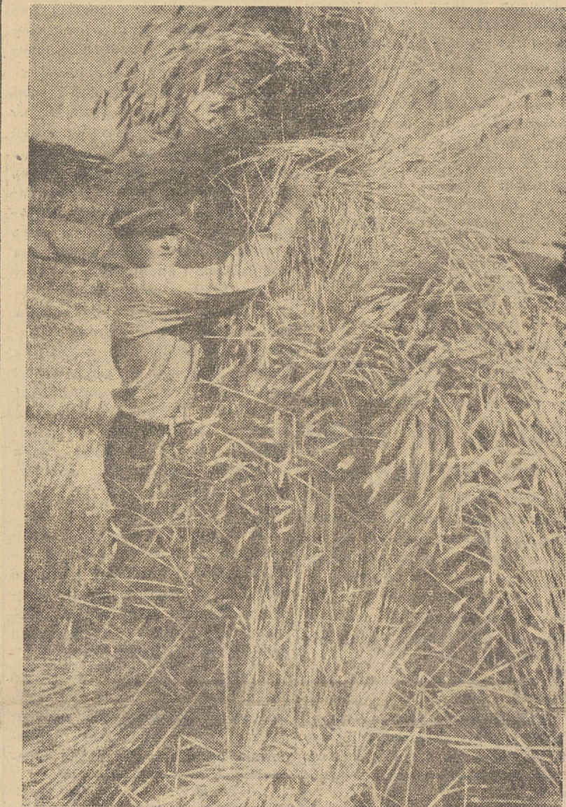
W województwie warszawskim żyto w większości zostało już zebrane. W tych dniach rozpoczyna się sprzęt pszenicy.

Dyskusje nad projektem zgaśli w pierwszej izbie socjalista Branting, oświadczając, że projektowana umowa jest nie do przyjęcia. Branting zaznaczył, że plan Marshalla jest pomocą dla Ameryki, a nie dla Europy, gdyż plan ten przygo-