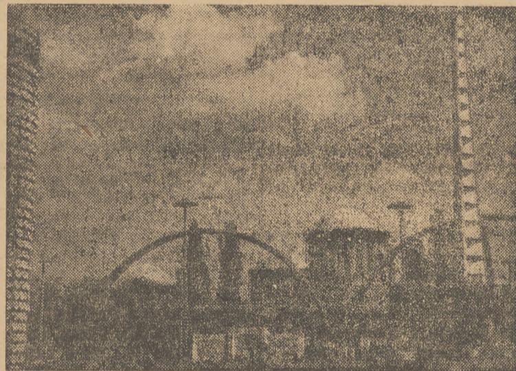
Fragment Pawilonu Czterech Kopuł. Z prawej strony widoczna iglica.

Zanim akcja ratunkowa powstrzymała epidemię, rolnicy w gminie Chrzęszczyce, Budkowice i Nowa Wieś ponieśli dotkliwe straty.