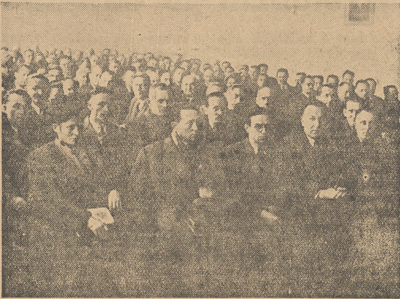
Konferencja aktywu nauczycielskiego SL w Poznaniu.

Dwudniowa konferencja aktywu nauczycielskiego Stronnictwa Ludowego w Poznaniu była przeglądem dorobku ideologicznego tych, którzy wychowują młodzież w duchu postępu, kształtują i urabiają oblicze wsi polskiej w du-