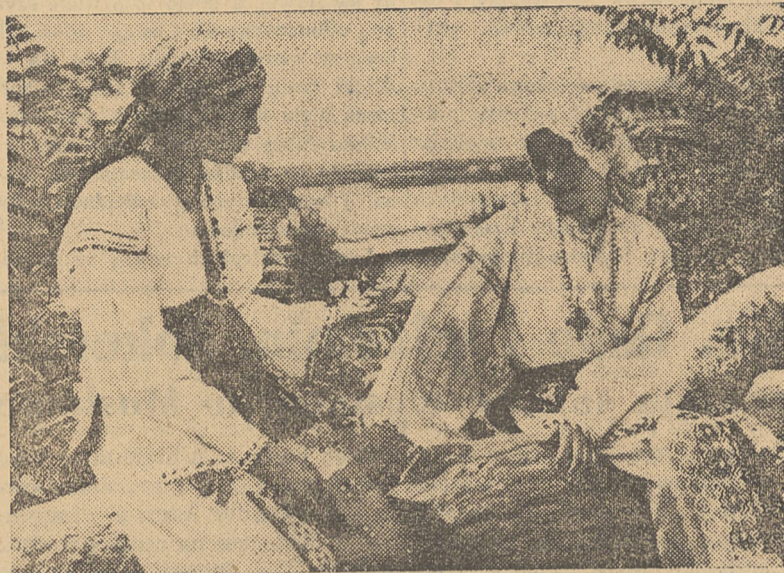
Dziewczęta rumuńskie w strojach ludowych.