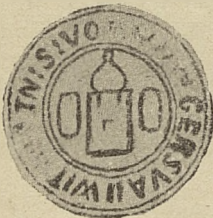
Zu Urk. № 4. de A o 1548 Juli 8.

Orig. Pap. niederd. 2 Deckblattsiegel. Siegel des Bürgermeisters obenstehend, ähnlich wie Briefl. IV. 21 30 u. 31, aber Siegelfeld nicht gleich, dagegen die Umschrift wie Bfl. IV. 21 31 doch durch Druck z. T. lädiert. Das Siegel des Hauscomturs (nicht Dietrich Schenking Bfl. IV. 56 8 ) sehr zerdrückt. Rev. St. A. B. D. 9. Vergl. Jahrb. f. Genealog. 1897 pag. 4. (Auch in der Urk. № 3 muss es wohl heissen: „scratemester“. Da die Gerichtsverhandlung wegen der zum Nachlass geh. Schulden etc. erst 1525 stattfand, kann der Schneider Johann nicht schon vor 1494 gestorben sein. Arbusow's Datierung der Urk. Jahrb. f. G. 1897 pag. 3 und s. Folgerungen für die Plettenberg'sche Genealogie pag. 3—5 verlieren dann den Boden).