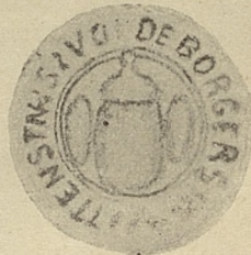
Zu Urk. № 5. de A o 1552 Juni 28*)

Bei beiden Siegeln ist in Folge des zu dicken und groben Deckblatts der Abdruck der Umschrift wenig scharf. Ausserdem hat die Umschrift des ersten Siegels, sowie das Siegelfeld und ein Teil der Umschrift des 2-ten Siegels einen starken deformierenden Druck erlitten. Ein Schreiben de A o 1554 Dec. 28 (friedages nach Christi geborth) vom Bürgerm. u. Rat von Weissenstein an Burgerm. u. Rat von Reval (welches ich erst nach vollendetem Abdruck des nebenstehenden Artikels im R. St. A. fand) hat in Folge der gleichen Uebelstände bei gut erhaltenem Siegelfeld eine total unleserliche Umschrift auf dem briefschl. Siegel.