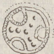
Nr. 12 a und b 2/1