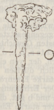
Nr. 5 1/1