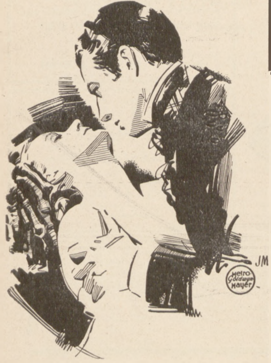
GRETA GARBO I ROBERT TAYLOR w „DAMIE KAMELJOWEJ” rez. C. Cukor