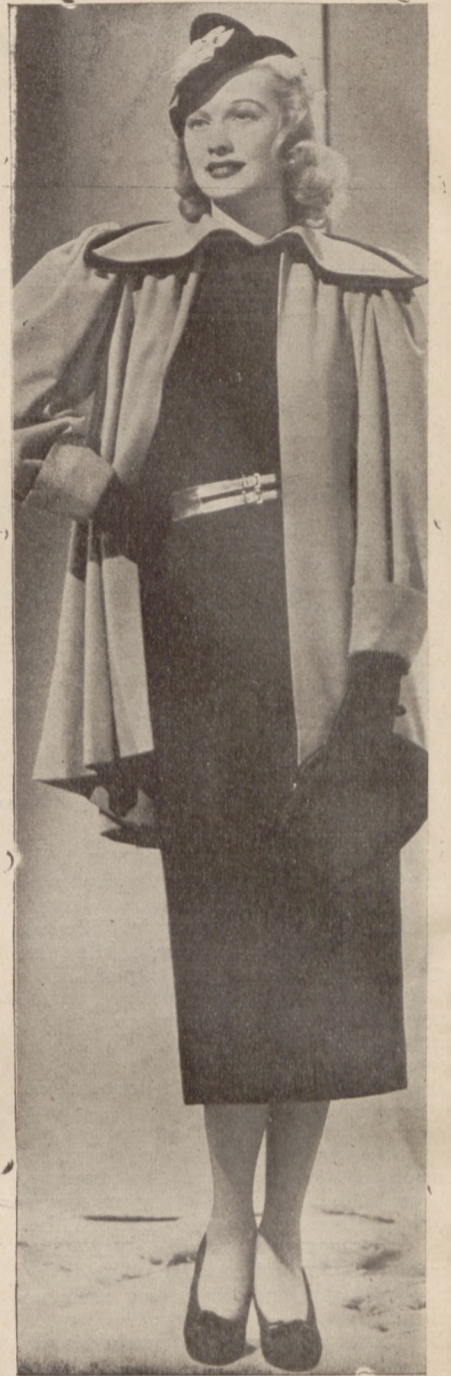
Suknia w kolorze granatowym. Płaszczek — jasno-niebieski. Rękawiczki, torba, pantofle — w ko- lorze sukni — i do tego podwójny wąski paseczek koralowy.

Modne są bardzo komplety kombinowane t. z. „praktyczne” np. płaszcz brązowy — do tego suknia o odcieniu zielonym — wykończona lub łączona z tymże brązowym. Sliczne jest połączenie jasnego granatu z koralowym, ogromnie modna jest krata — stosowana do kompletów trzykwierciowych n. p. kraciasta sukienka, gładki płaszcz lub vice-versa. Kostjumy wybitnie angielskie przewiduje moda tegoroczna również z różnorodnych tkanin — diagonalów, w drobne kratki o wielkiej różnorodności odmian w dziedzinie, klap, kieszeni i patek. Spódnica b. krótka. Bluzki w tysiącach fasonów, całej gamie pastelowych odcieni — przybrane haftami z plisowaniem, szczypankami, stebnowkami — wśród których prym będą wodzyły niegdyś modne tak dawno nie widziane siutaze. Nell