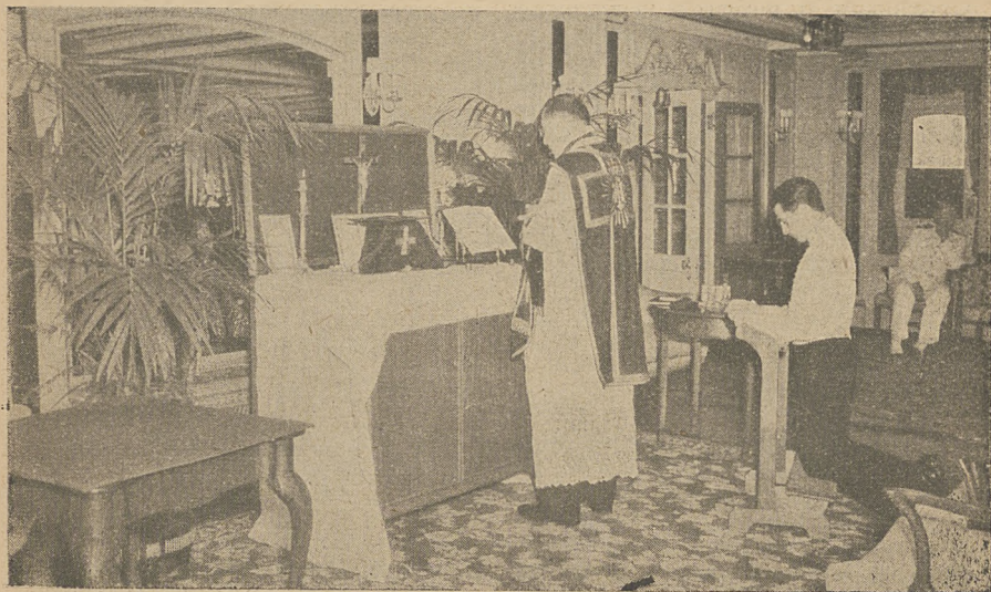
Ks. Prowincjał na pokładzie m/s Batorego przy Mszy św.

Wczesną wiosną 1937 r. wyrusza w towarzystwie jednego kapłana do Ar-