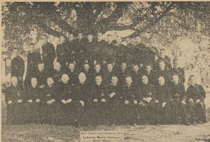
Klerycy saletyńscy z Olivet, rok 1949.

patu Polski zatwierdzenie Komunii św. Wynagradzającej 19-go każdego miesiąca. Zakłada „Grosz na powołania kapłańskie“ i wreszcie we wrześniu 1921 r. przychodzi na świat pierwszy numer „Poślątka Matki Boskiej Saletyńskiej“ którego celem było i jest, jak czytamy w „Słowie wstępnym“ informowanie Czytelników o postępach nabożeństwa saletyńskiego w kraju i za granicą.