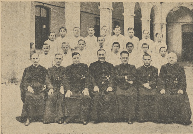
Małe Seminarium w Santa Rosa w Argentynie. Rok 1949.

kich przedmiotów obowiązującego w Belgii programu szkół średnich, zdobywając wkrótce nagrody za klasyczne wypracowania w języku francuskim!