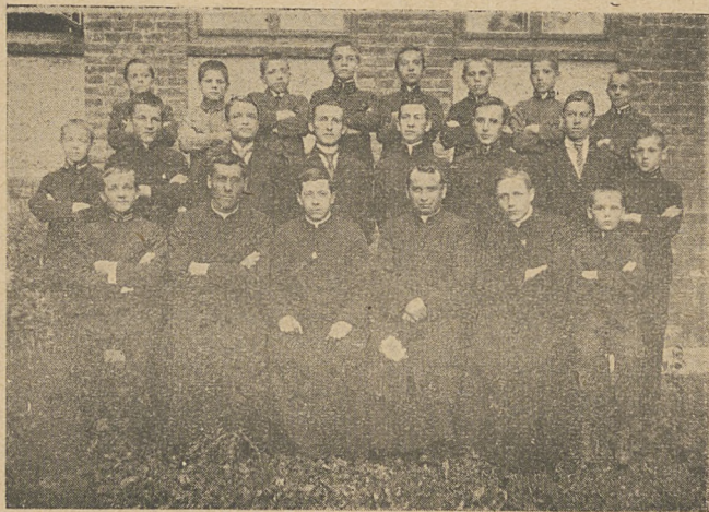
Ks. Prowincjał wśród uczniów Małego Sem. w Dębowcu po powrocie do Polski. Rok 1919.

Pracowitemu Ks. Prefektowi nie wystarczały, że tak powiem oficjalne zajęcia. Postawił sobie za cel apostołstwo. Zaprażył, by cześć Matki Boskiej Saletyńskiej rozeszła się szeroko po polskiej ziemi. W tym celu zakłada „Kółko zelatorów i zelatorek Matki Boskiej Saletyńskiej”. Zabiega i wyjednuje u Episko-