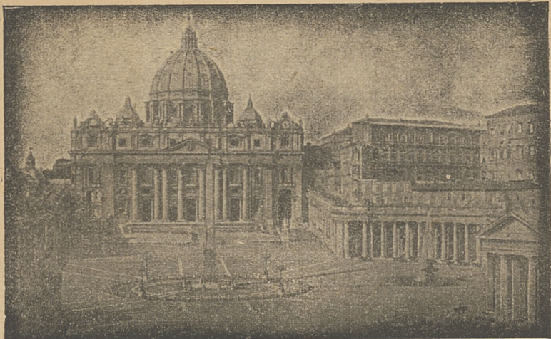
Bazylika św. Piotra w Rzymie.