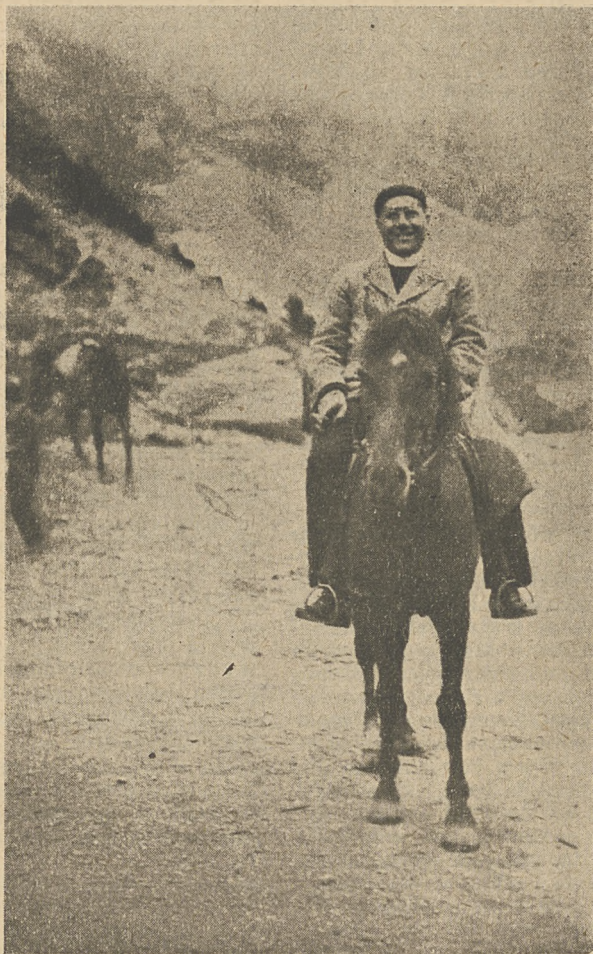
Ks. Prowincjal w drodze do swoich misjonarzy. (Arg.)

mogą się poszczycić posiadaniem wła- snego Małego Seminarium, w którym dwudziestu młodych chłopców przygo- towuje się do zawodu kapłańskiego,