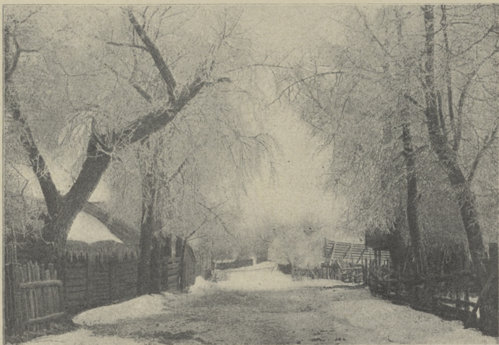
16. Z OKOLIC NOWOGRÓDKA.