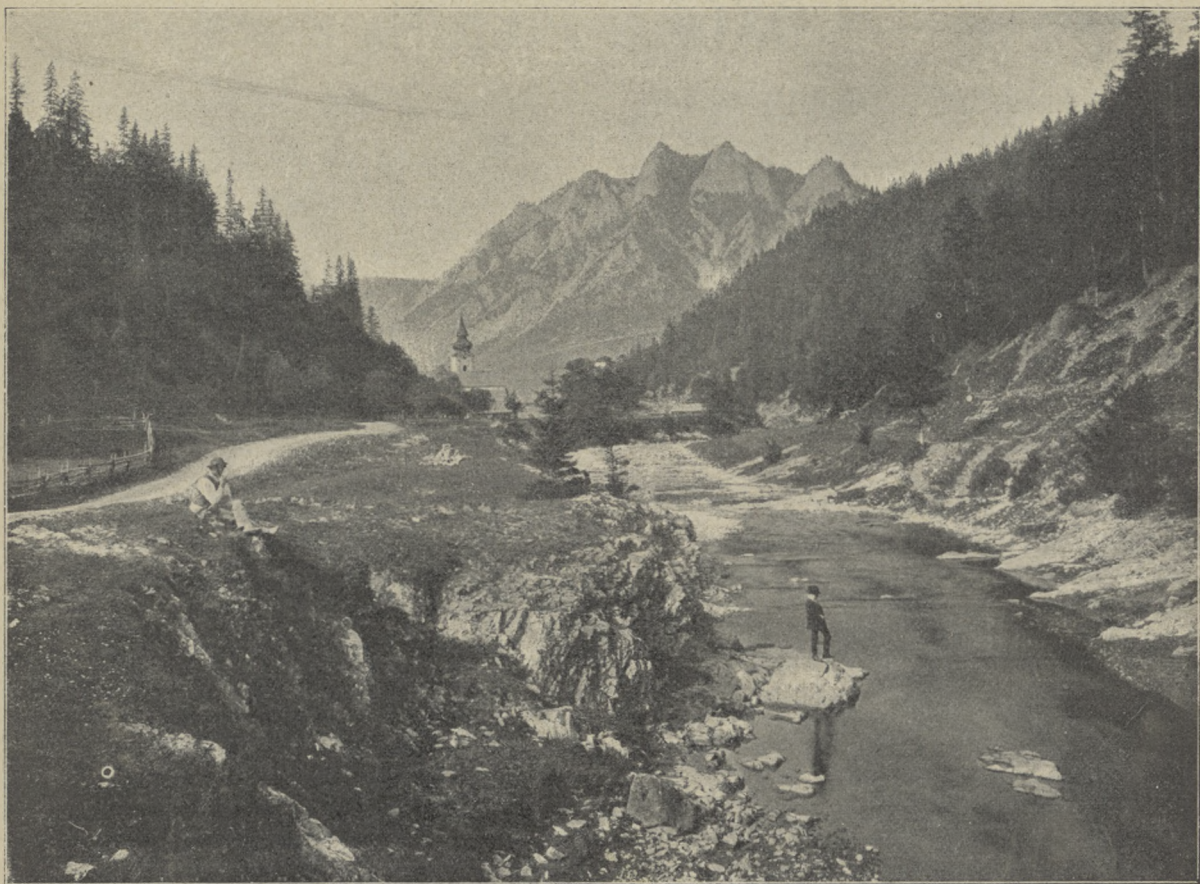
CZERWONY KLASZTOR I TRZY KORONY W PIENINACH