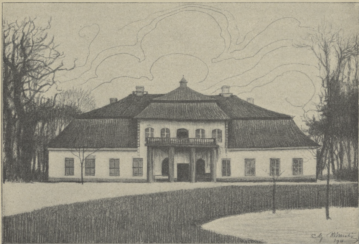
DWÓR W WIELICKU