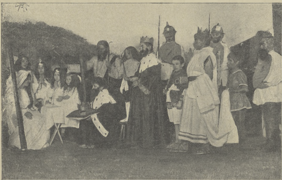
„MĘDRCY ŚWIATA, MONARCHOWIE...”